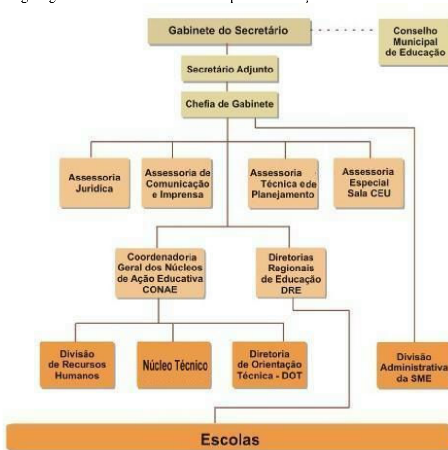
Organograma 1 – da Secretaria municipal de Educação