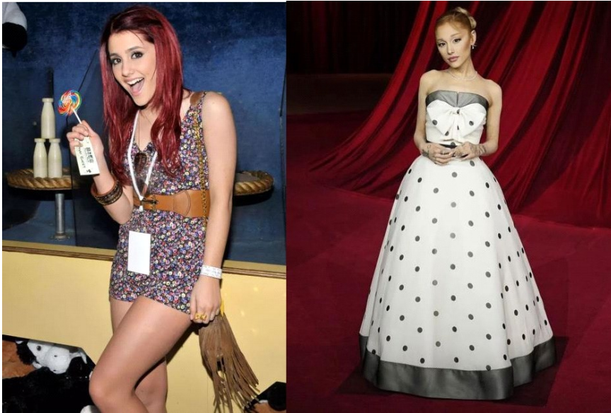
(Atriz e cantora estadunidense, Ariana Grande, em 2012 e em 2025)

As influenciadoras digitais tornam esse cenário ainda mais complexo, porque não atuam apenas como vitrines de imagens, mas como narradoras de rotinas que parecem próximas da vida comum. Elas falam sobre alimentação, mostram exercícios, compartilham suas inseguranças e dão dicas que soam acessíveis. Garcia e Silveira (2024, p. 3) ressaltam que esse tipo de proximidade produz um efeito aspiracional peculiar, já que o público não vê apenas o corpo magro, mas também a narrativa de disciplina e esforço que o acompanha. A estética da fragilidade passa a ser apresentada como prova de dedicação, conquistada pelo controle de si mesma, e não como sinal de adoecimento. Essa combinação de imagem e narrativa fortalece o padrão, porque o associa a valores positivos como força de vontade e autocontrole.