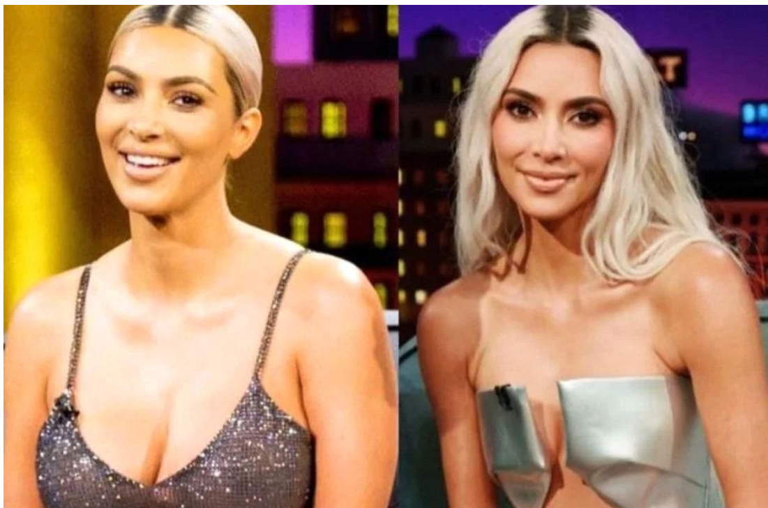
(Socialite e influencer Kim Kardashian. No programa The Late Late Show with James Corden em 2017 e em 2022)

interessante notar como, nesse caso, a decisão de uma única celebridade se multiplica por meio das redes e passa a ser interpretada como sinal de mudança de padrão, algo que, em outro contexto histórico, dependeria de campanhas orquestradas por toda uma indústria.