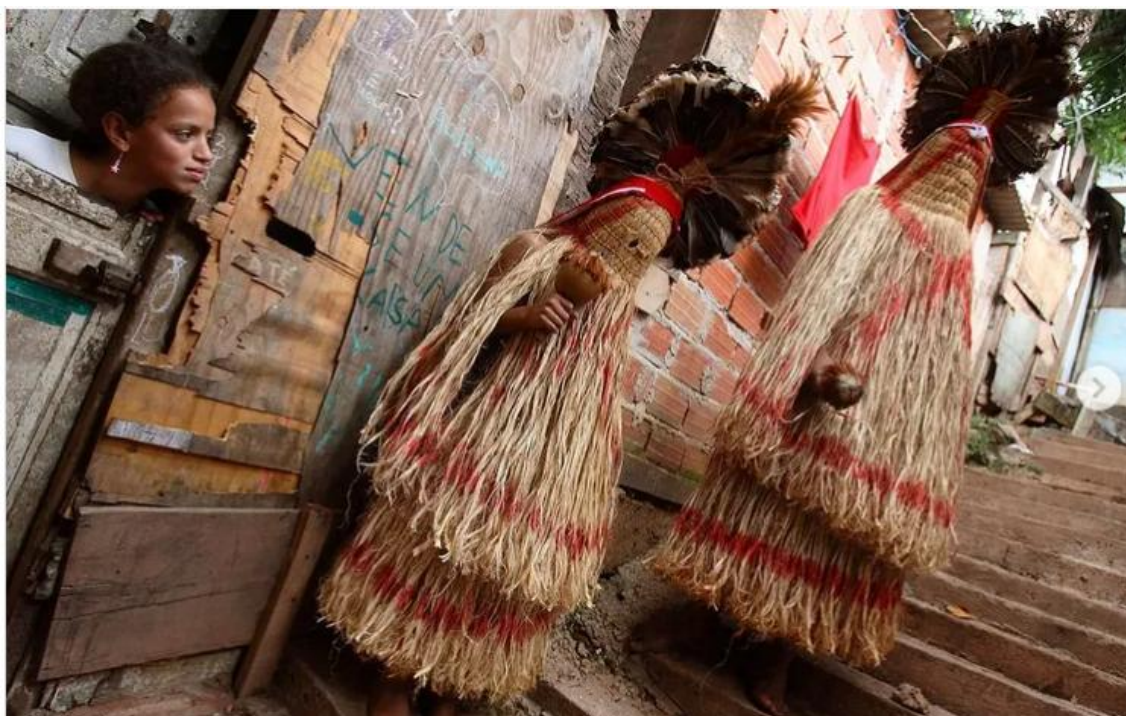
Figura 2- Praiás Pankararu circulando pelo Real Parque (2006)