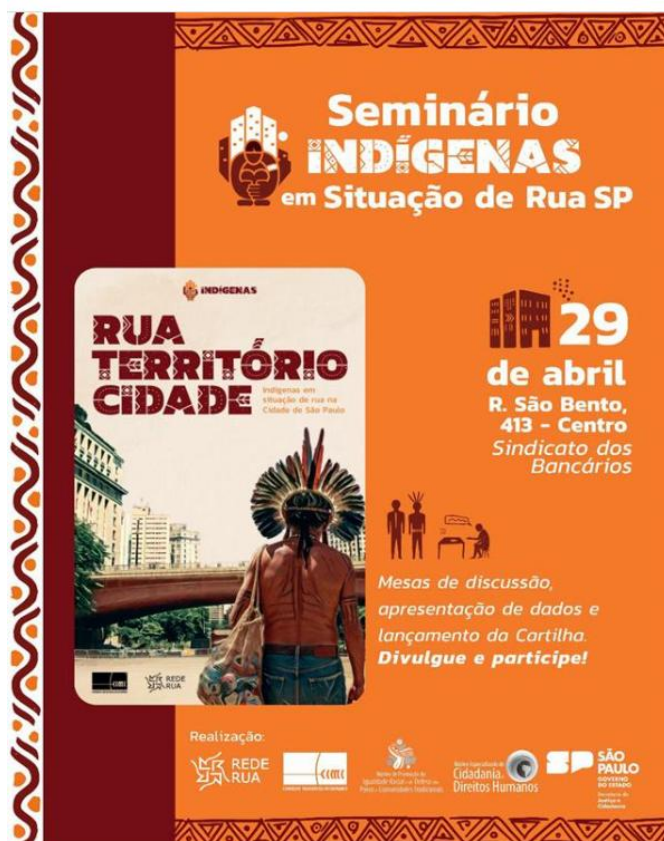
Figura 11-Divulgação do Seminário