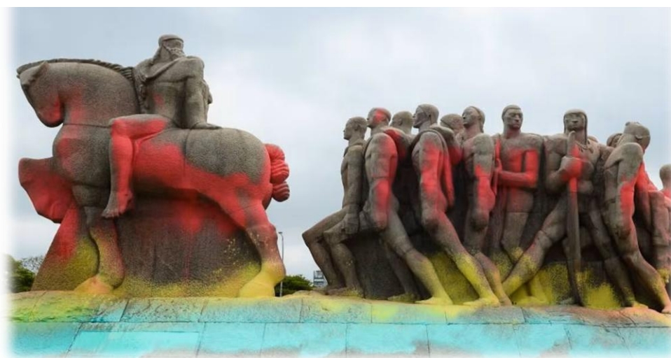
Figura 18- Monumento às Bandeiras