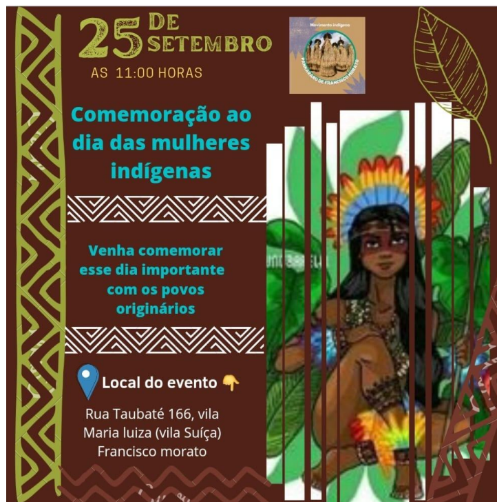
Figura 23- Convite Evento das Mulheres Pankararu de Francisco Morato