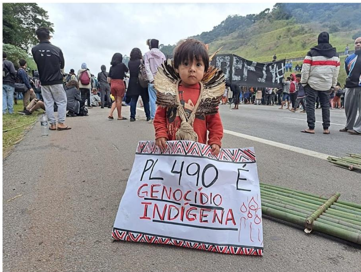
Figura 20- Protesto contra o PL 490 na Rodovia dos Bandeirantes (2021)

Além de um ancião de 106 anos, o protesto reprimido pela polícia tinha dezenas de crianças