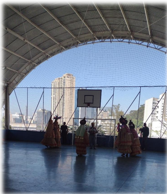
Figura 13- Dança dos Praiá – Encontro Anual Pankararu (2022)

a intenção do ato de tradução como ato performático —dança dos praiás foi a de evocar e construir no imaginário público dessas arenas a —cara de índio, a —língua de índio e o deslocamento histórico e geográfico que os constringia à invisibilidade. Visibilizando assim um mecanismo de —tomada de consciência do arbitrário contra o preconceito fenotípico, linguístico e político-administrativo