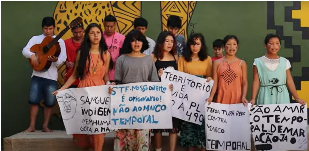
Figura 17- Captura do vídeo "Museu das Culturas Indígenas Institucional"