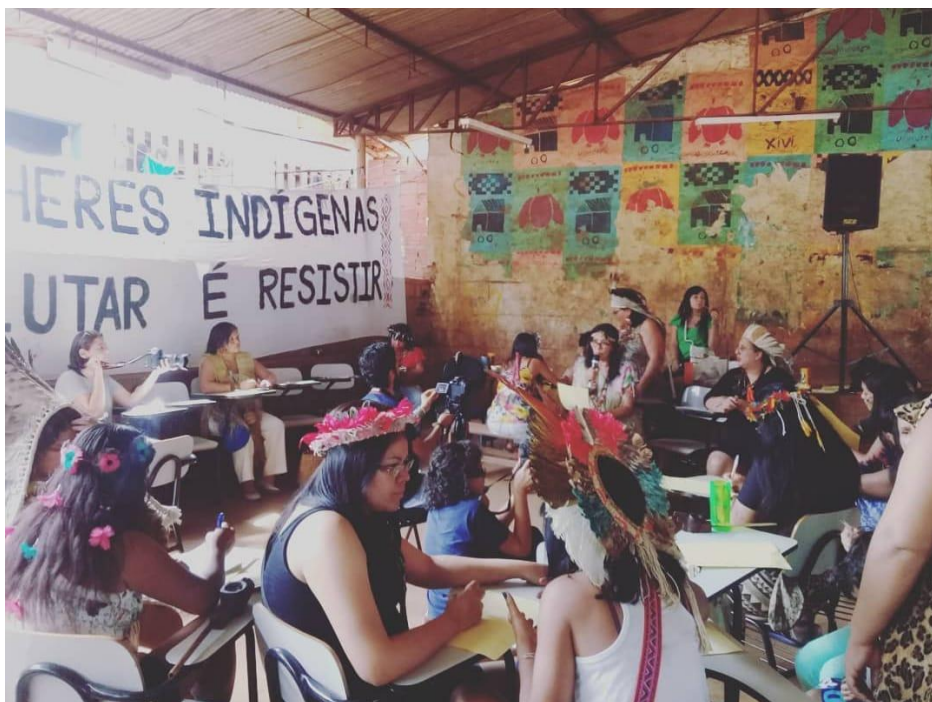
Figura 22- Encontro Indígenas Mulheres (2018)