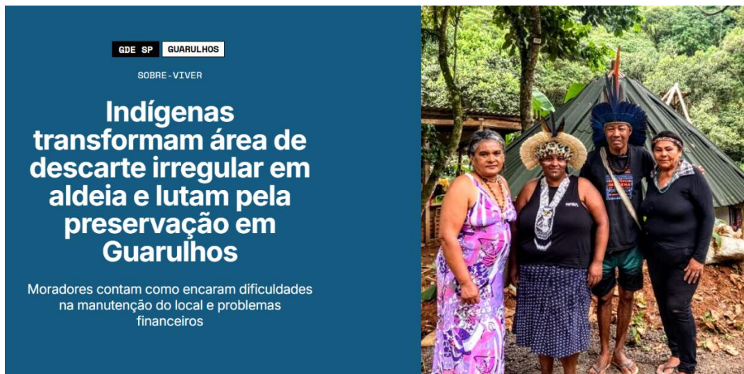
Figura 4-Manchete com moradores da Aldeia Multiétnica

cada povo, existem elementos étnicos e culturais que os dividem, quanto como como um potencial de organização coletiva para a luta por direitos.