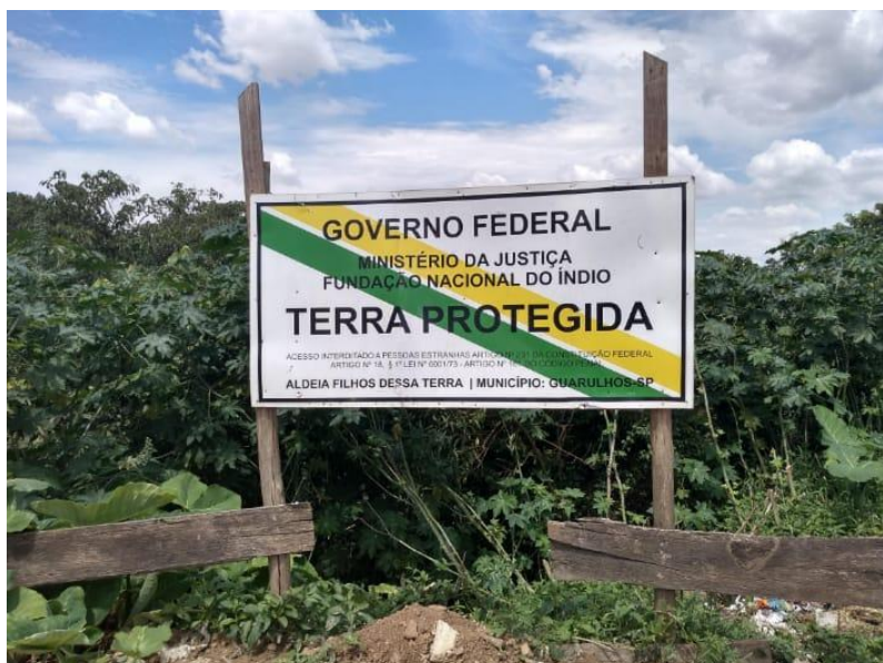
Figura 21- Entrada Aldeia Multiétnica

Quando a gente fala de um território tradicional, eles pensam que a gente não oferece nada, porque nessa terra a gente não paga imposto, não paga água, não paga luz, não paga nada por essa terra, por se tratar de um território indígena. Desse modo, para o governo não é interessante demarcar essa terra, mas pegar essa terra e vender e fazer condomínios. Tem muito interesse por trás disso, e não é só Guarulhos, é o Brasil inteiro. (AWA TUPI-GUARANI, 2024, p.98)