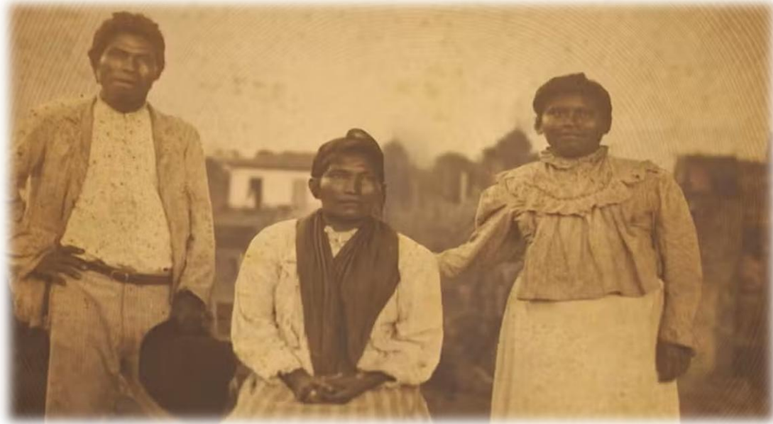
Figura 6- Família indígena com roupas de brancos em 1905 em São Paulo