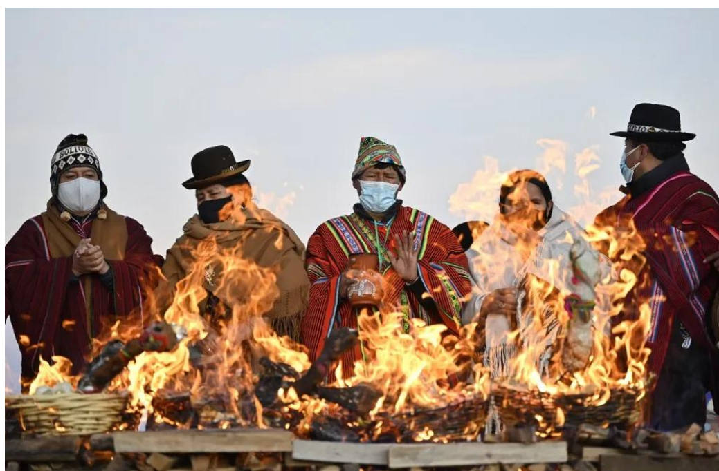
Figura 16- Imagem de cerimônia na cidade de Tiwanaku, na Bolívia, em 21 de junho de 2021