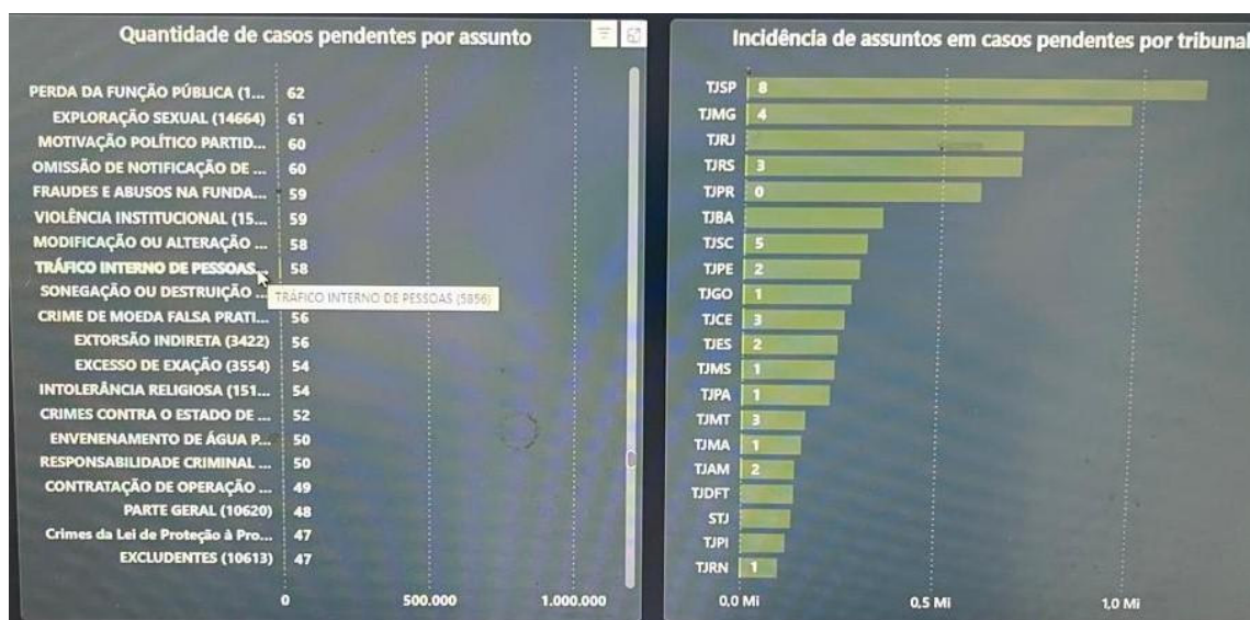
Figura 3 – Feitos pendentes registrados como imputações de tráfico interno de pessoas em janeiro de 2025