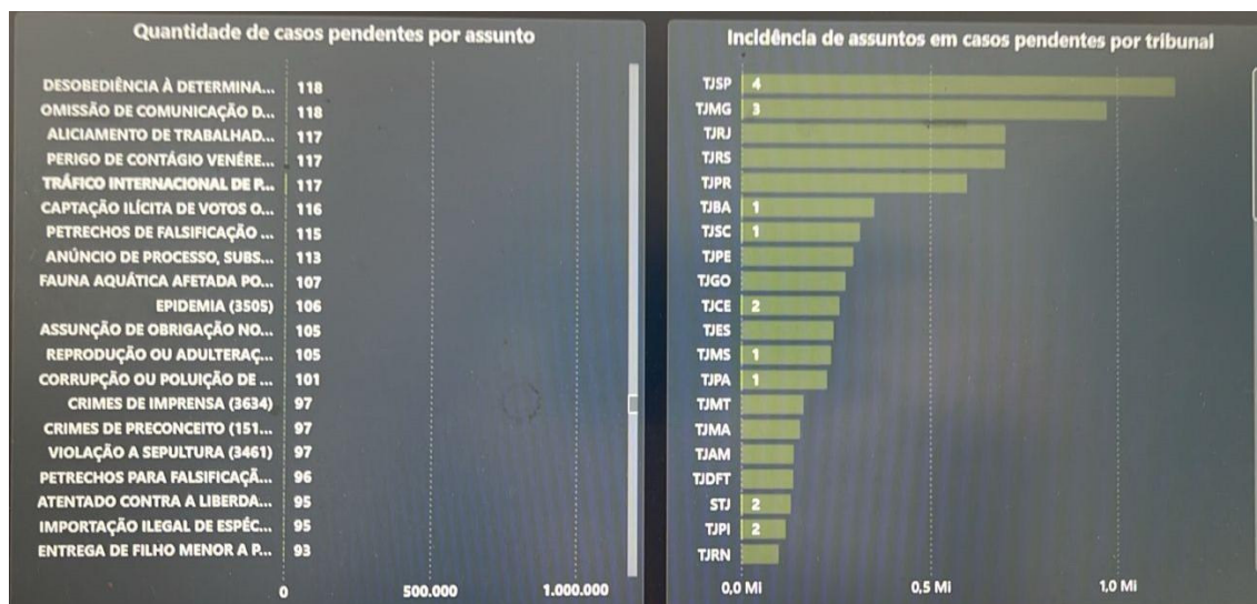
Figura 2 – Feitos pendentes registrados como imputações de tráfico internacional de pessoas em janeiro de 2025