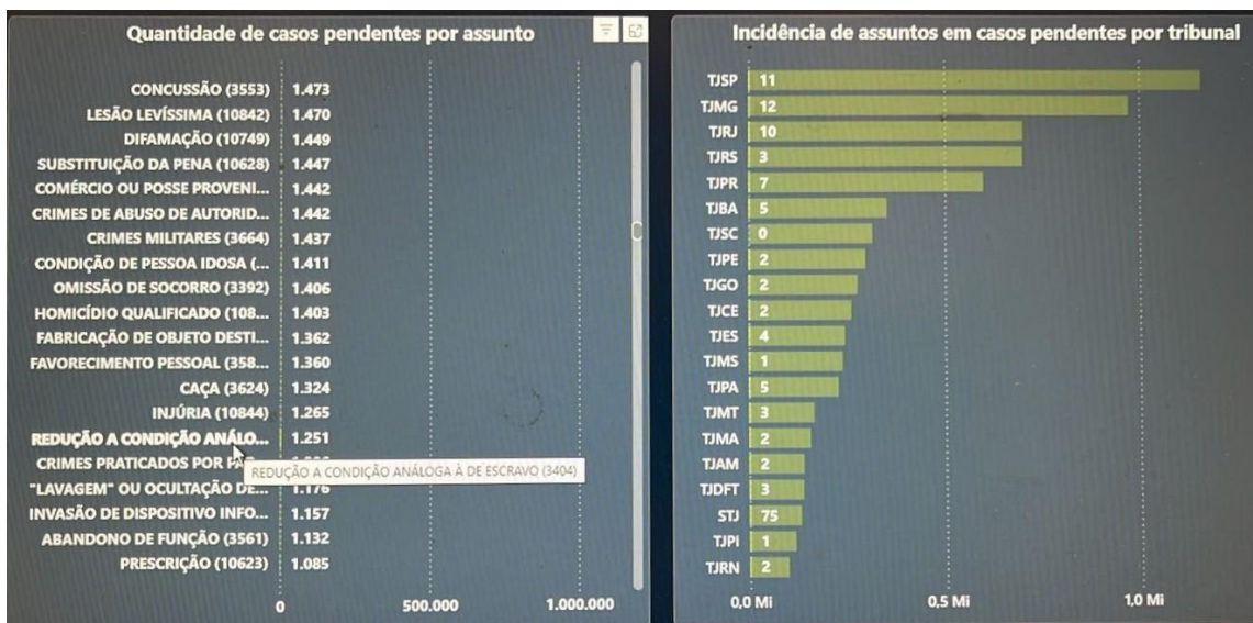
Figura 5 – Feitos pendentes registrados como imputações de redução à condição análoga à de escravo em janeiro de 2025