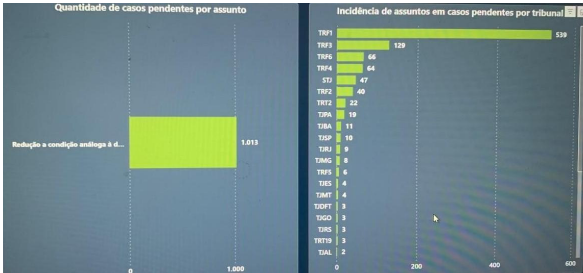
Figura 4 – Feitos pendentes registrados como imputações de redução à condição análoga à de escravo em janeiro de 2024

análoga à de escravo pendentes em janeiro 2025 somam 1.251 (Figura 5), um aumento considerável, porém, em nada comparado à quantidade de ações trabalhistas pendentes sob a mesma rubrica (Figuras 6 e 7).