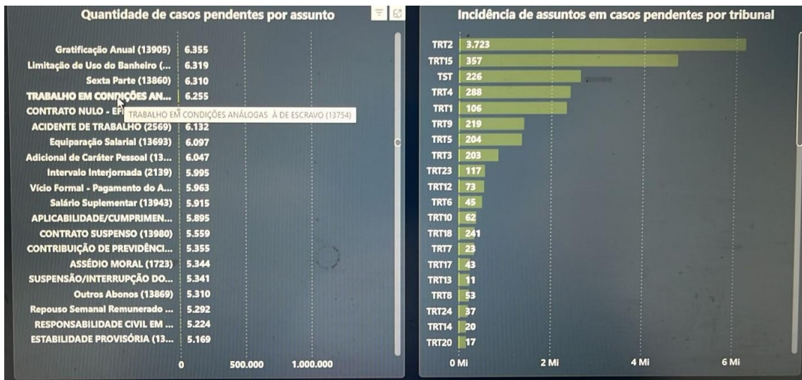
Figura 7 – Feitos registrados como imputações de redução à condição análoga à de escravo na Justiça do Trabalho em janeiro de 2025