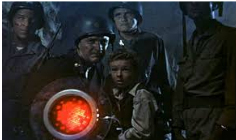
Figura 3: David consegue uma saída

Se instaura uma missão perigosa nos túneis construídos pelos marcianos, enquanto os militares posicionam dinamites dentro da nave espacial, David e Pat buscam uma saída enquanto fogem dos marcianos. Em um movimento corajoso, David encontra uma arma infravermelha que permite a escapada para todos, momentos antes da grande explosão que destrói a nave espacial.