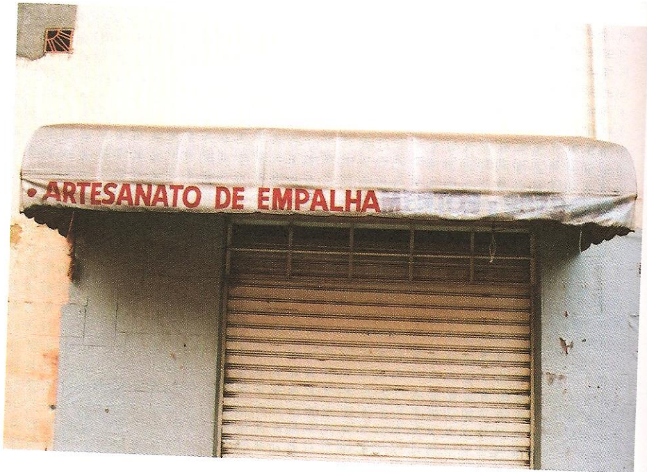
Figura 3 51