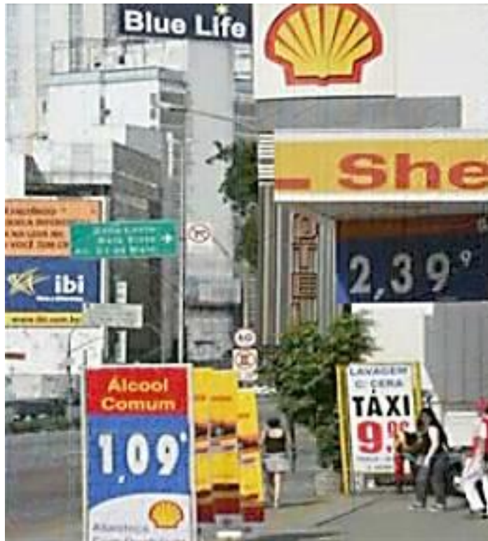
Figuras 11 e 12