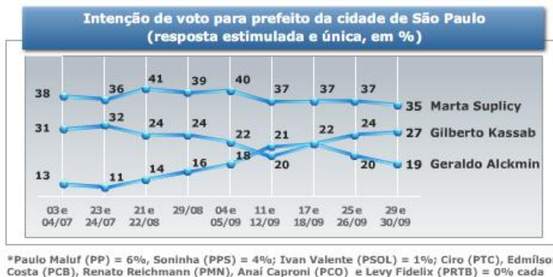
Gráfico 1 – Quadro da evolução dos candidatos ao cargo de prefeito. Ao observar a linha de evolução nas pesquisas, Gilberto Kassab é o único que manteve crescimento constante, enquanto os adversários caíram ou se mantiveram em ligeira queda. (Datafolha – On line).

O quadro abaixo mostra o resultado da eleição, ocorrida no dia 5 de outubro de 2008, em que Gilberto Kassab havia conseguido consolidar os seus votos junto aos eleitores de São Paulo ao chegar em primeiro, depois de passar toda eleição atrás dos adversários. De todos os cenários possíveis analisados meses antes da eleição, Marta e Geraldo eram os nomes mais fortes pela disputa à prefeitura. A inversão na preferência do eleitorado não foi captada, em sua maior parte, pelas avaliações e sondagens dos institutos de pesquisas. Kassab conseguiu atingir 33% da votação, bem acima dos 27% das pesquisas. Marta e Geraldo ficaram dentro da margem de erro prevista nas sondagens, o que pode indicar que os votos dos indecisos acabaram sendo creditados a Kassab.