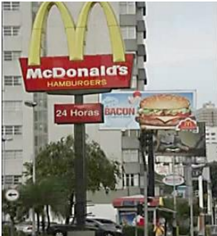
Figuras 9 e 10