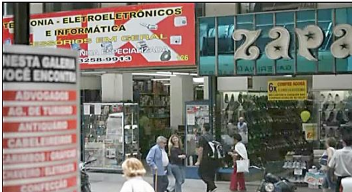
Figuras 7 e 8