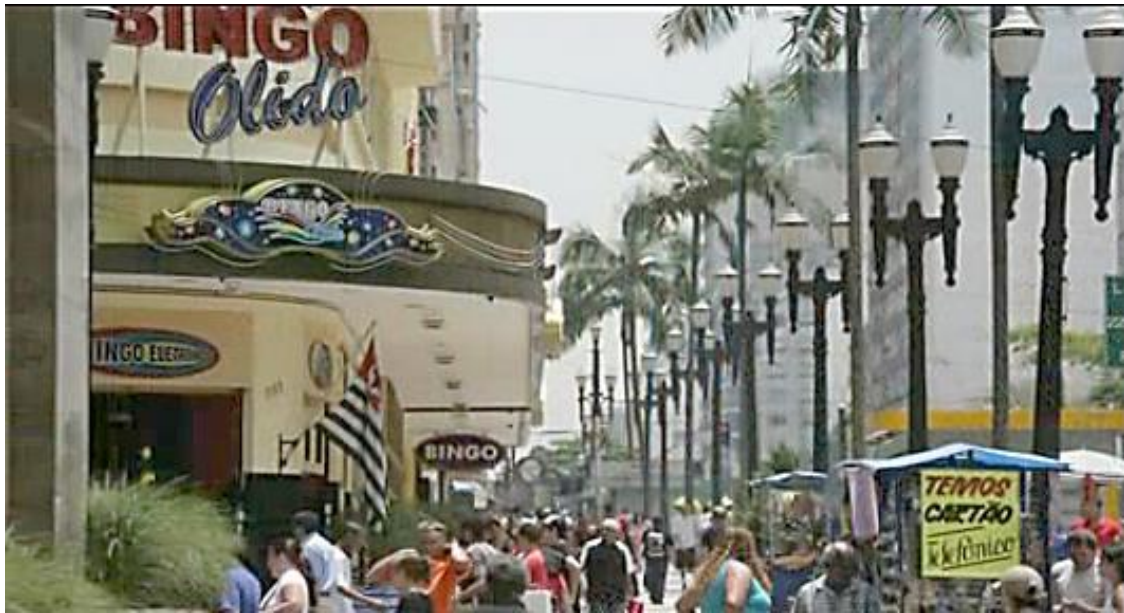
Figuras 1 e 2