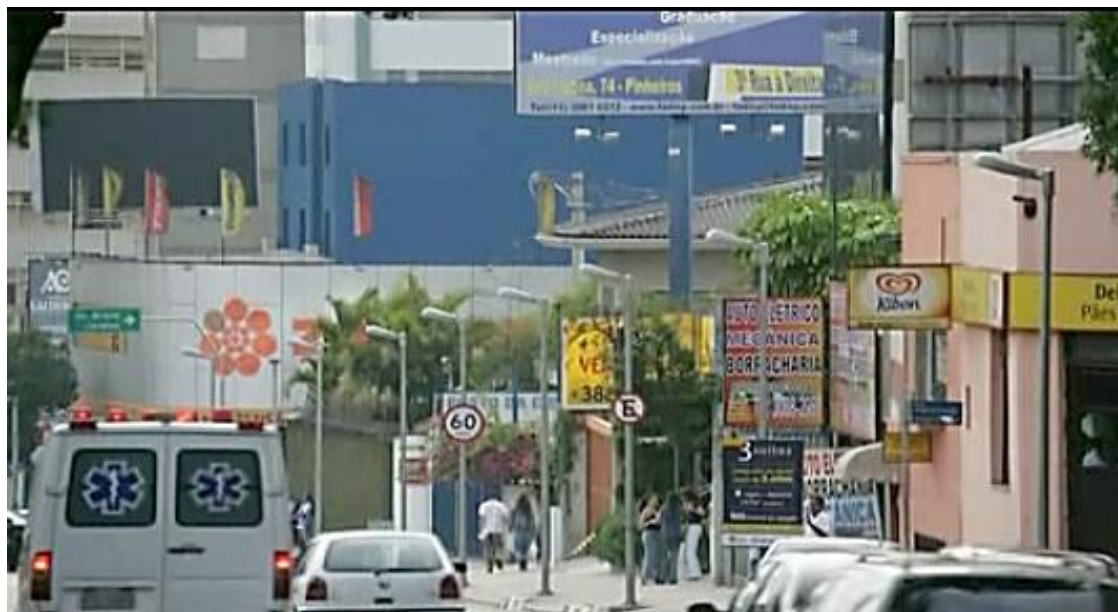
Figuras 17 e 18 50