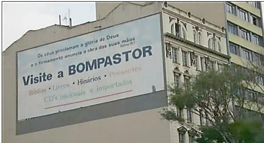
Figuras 3 E 4