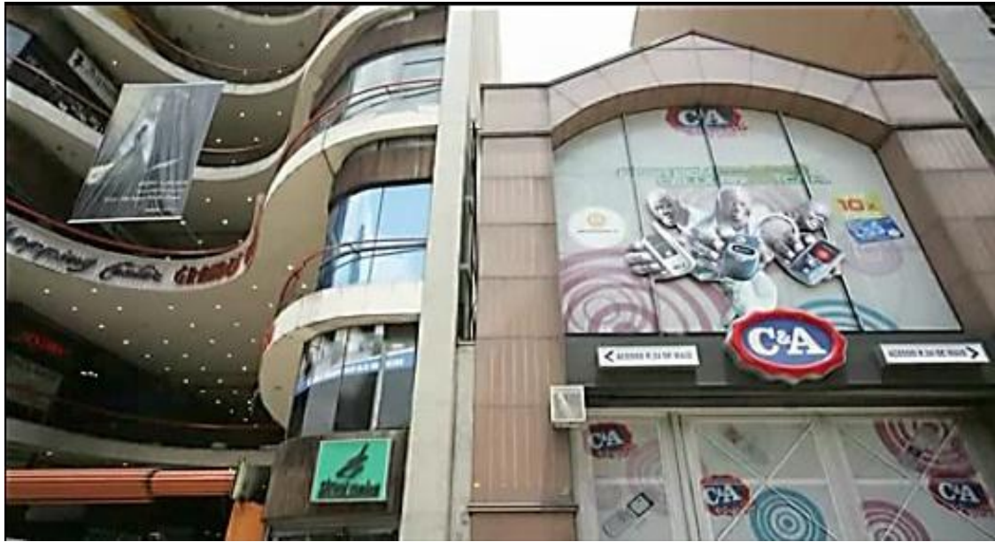
Figuras 5 e 6