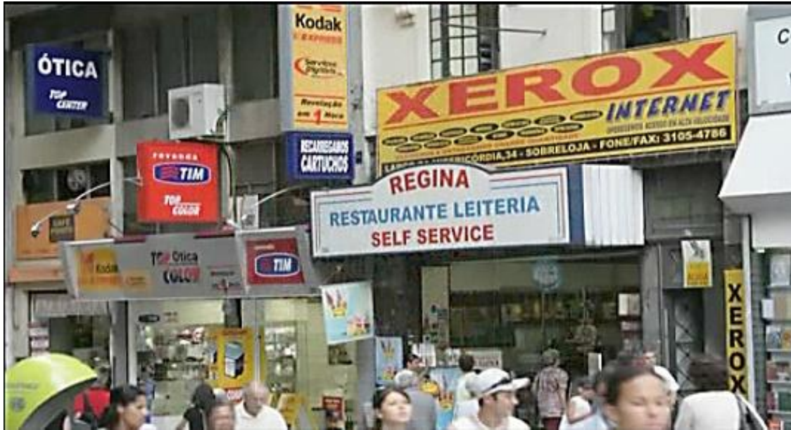
Figuras 13 e 14