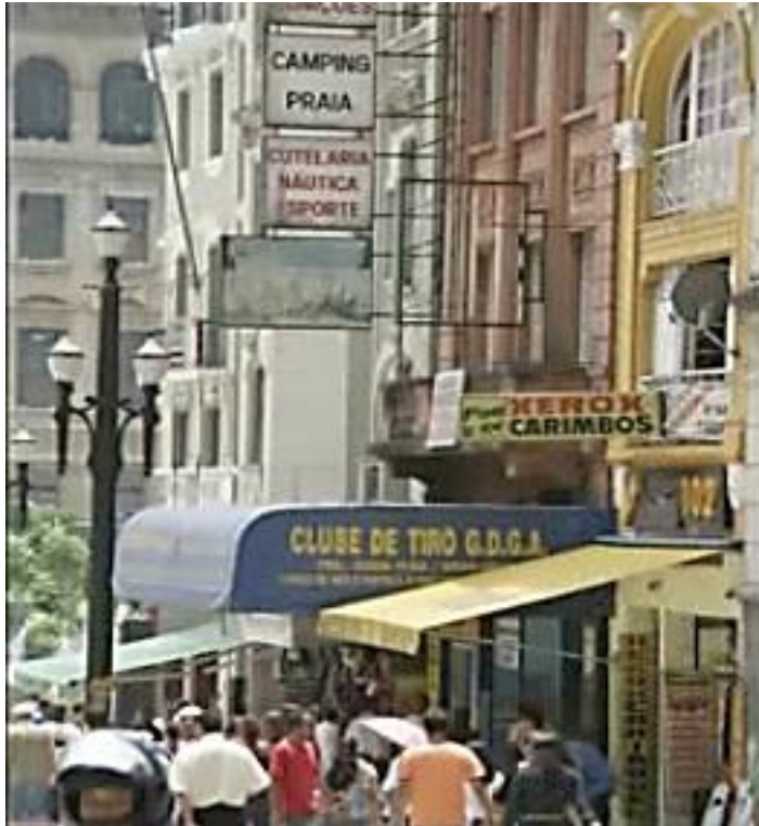
Figuras 15 e 16