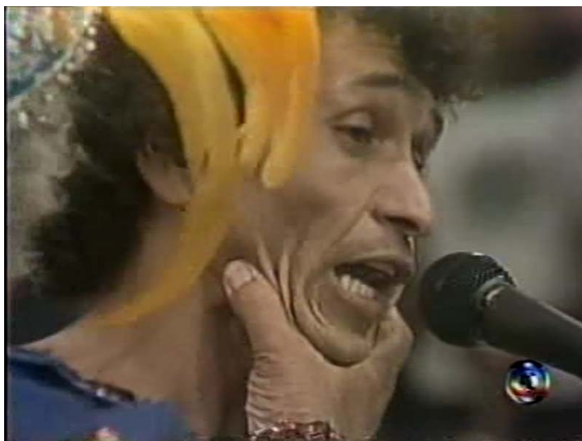
Fig. 11: Chacrinha posiciona “docemente” o calouro no microfone.

(A câmera focaliza a atriz citada por Chacrinha)