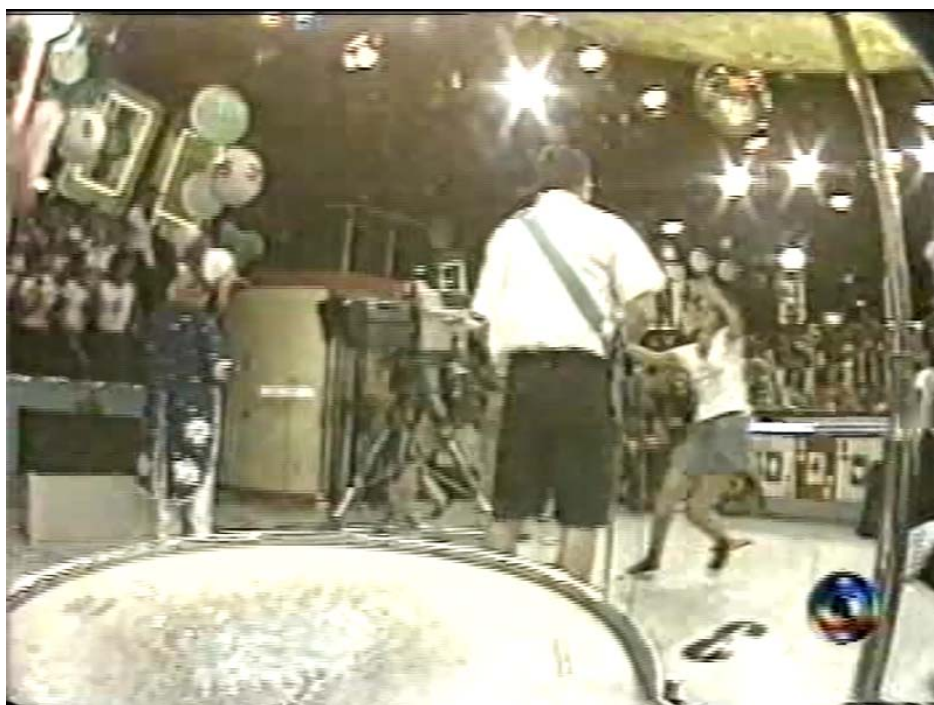
Fig. 13: Câmera subjetiva do baterista do grupo Paralamas do Sucesso.

Uma fã invade o palco para agarrar o cantor Hebert Vianna e o assistente de palco Russo impede em meio ao som de uma sirene. Outras fãs mais afoitas também invadem o palco, enquanto uma câmera focaliza o grupo de costas, como se estivesse ao lado do baterista, quando a câmera retorna para frente, Chacrinha se posiciona na frente do grupo. Ao término da apresentação, Chacrinha chama a vinheta e finaliza o bloco.