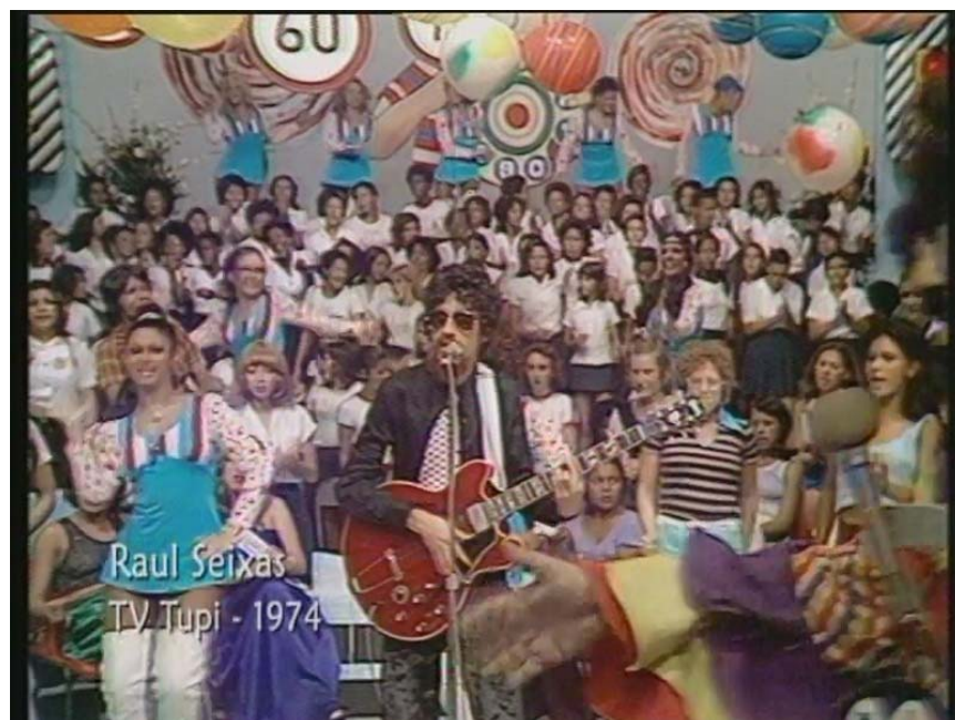
Fig.3: O cantor Raul Seixas no Programa Discoteca do Chacrinha na TV Tupi em 1974.

de 1970, o publicitário paulista Washigton Olivetto foi convidado a receber o Troféu Velho Guerreiro de melhor publicitário. Para muitos, na época, era um absurdo um profissional já muito respeitado ir até aquele programa. Porém, Olivetto não apenas foi com o maior prazer receber o prêmio como participou de toda a pré-produção, ficando encantado com a preparação do programa e o metódico ritmo de trabalho do apresentador. Chacrinha explicou ao publicitário que tudo deveria estar minimamente organizado para que ele entrasse e desorganizasse tudo (VERÍSSIMO, 2005, p.68-76).