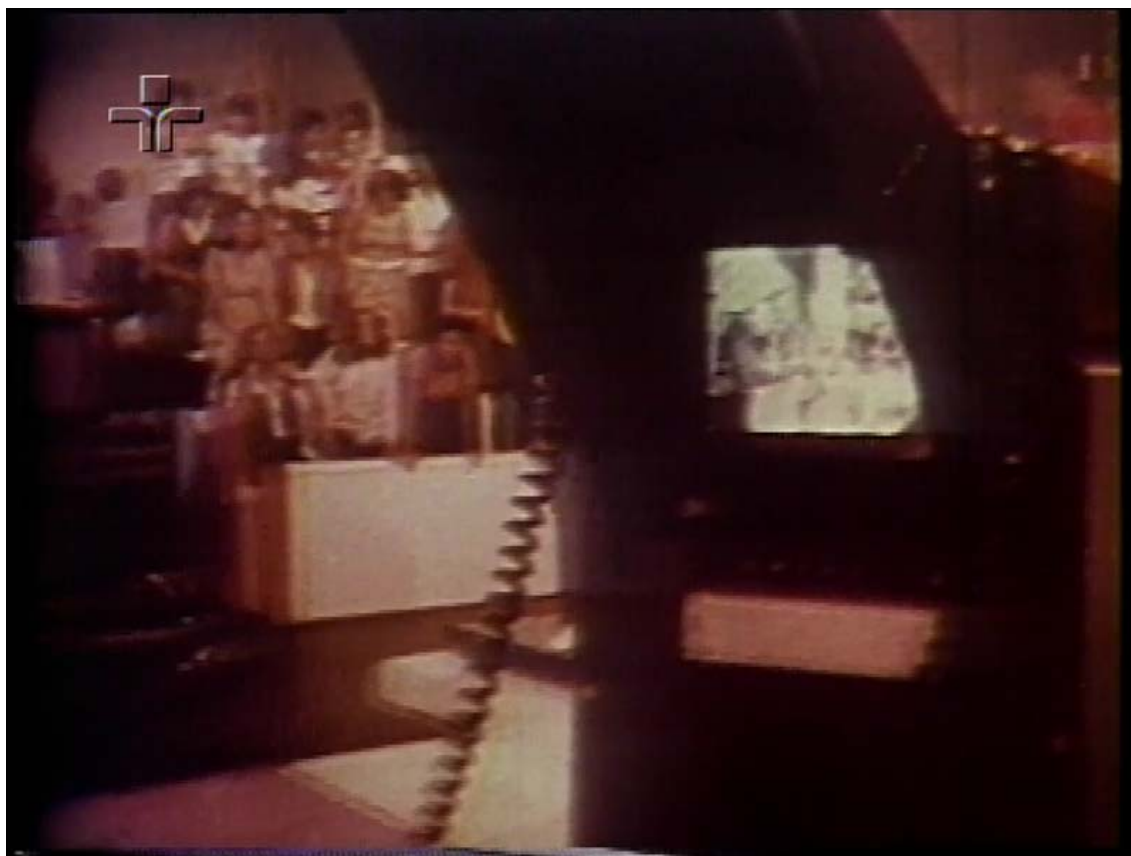
Fig. 4: O inusitado na televisão era uma das marcas dos programas do Chacrinha, que tentava inovar com enquadramentos de câmeras diferentes.

No início de sua carreira na televisão, Chacrinha já acumulava uma larga experiência do rádio e sentiu dificuldades para adaptar seu estilo ao meio televisual. Embora tentasse compreender os mistérios da televisão, a saída foi fazer um programa de rádio televisionado: