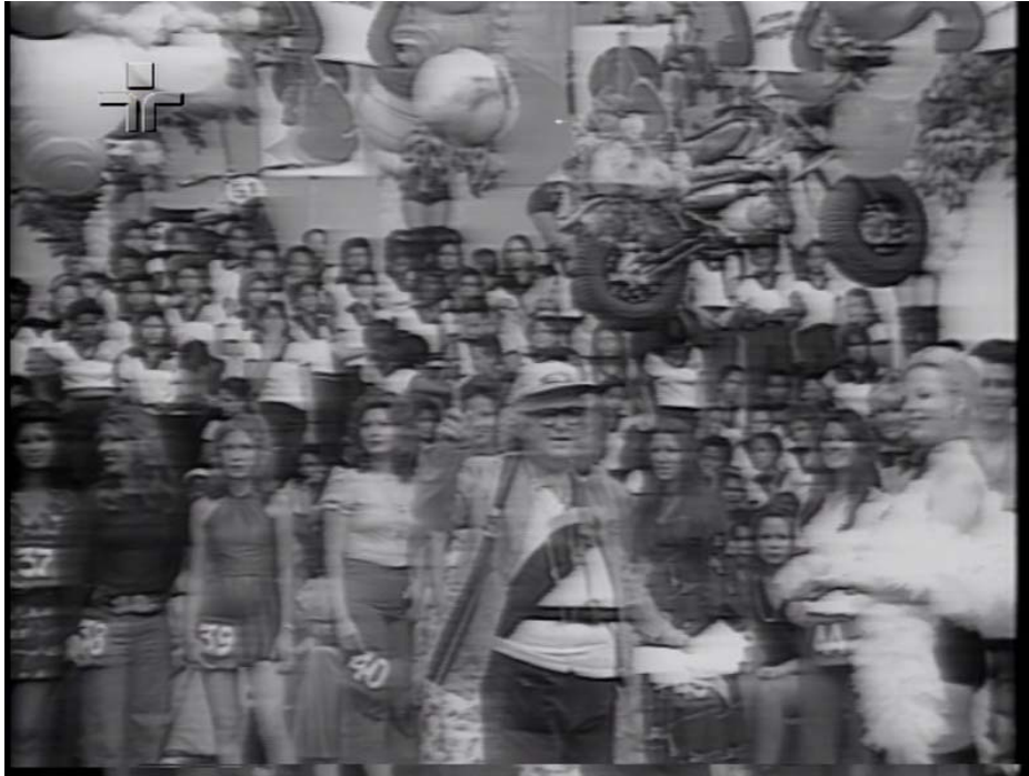
Fig. 6: Chacrinha pede atenção, entre diversos elementos visuais. A tela está totalmente preenchida.

Fonte: Programa Discoteca do Chacrinha , Acervo Cinemateca Brasileira