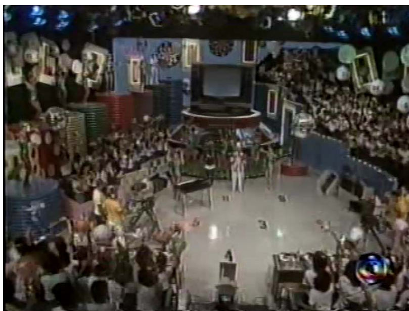
Fig. 9: Plano Geral do Palco e Auditório

Ao término das apresentações dos jurados, Chacrinha começa a dar os seus recados sendo que, a todo o momento suas falas são intercaladas por diversos sons: sirenes, baterias e algumas músicas. Ressalta-se que os recados, tanto era uma maneira de manter o telespectador atento sobre as caravanas que o apresentador fazia, como para destacar seus patrocinadores. Este momento era utilizado para se preparar o palco para a próxima atração.