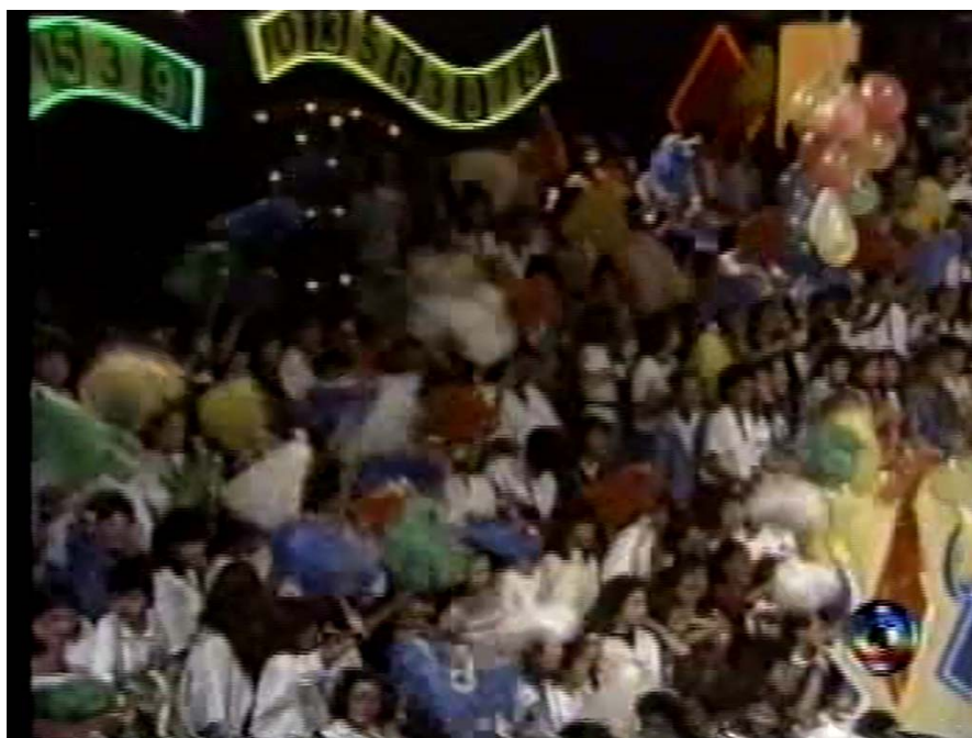
Fig. 5: A participação do público no auditório era sempre exagerada e com muitos movimentos.

No programa da TV Globo, seu ajudante de palco Russo interfere no decorrer do programa, interagindo com o público, com os artistas e com o próprio Chacrinha em uma lógica que vários programas de auditório atuais não aceitam. Durante a apresentação dos cantores e cantoras, artistas, jurados o público e é claro o próprio Chacrinha se movimentam a todo momento, batem muitas palmas, tem risos exagerados, de nítida exaltação para a câmera.