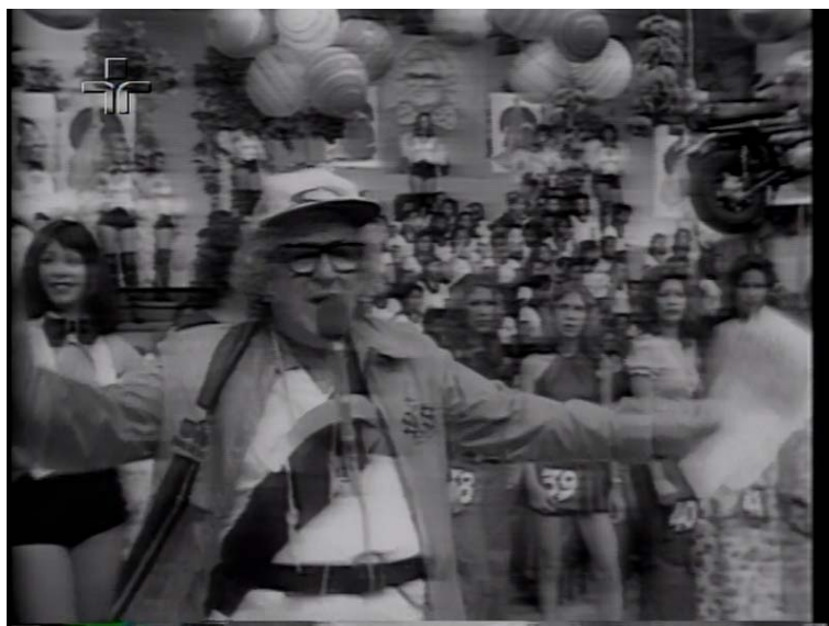
Fig. 7: Chacrinha na frente do Palco do Programa Discoteca do Chacrinha.

Volta para o centro do palco e fala: “ Alô! Atenção! ”- e de repente canta: