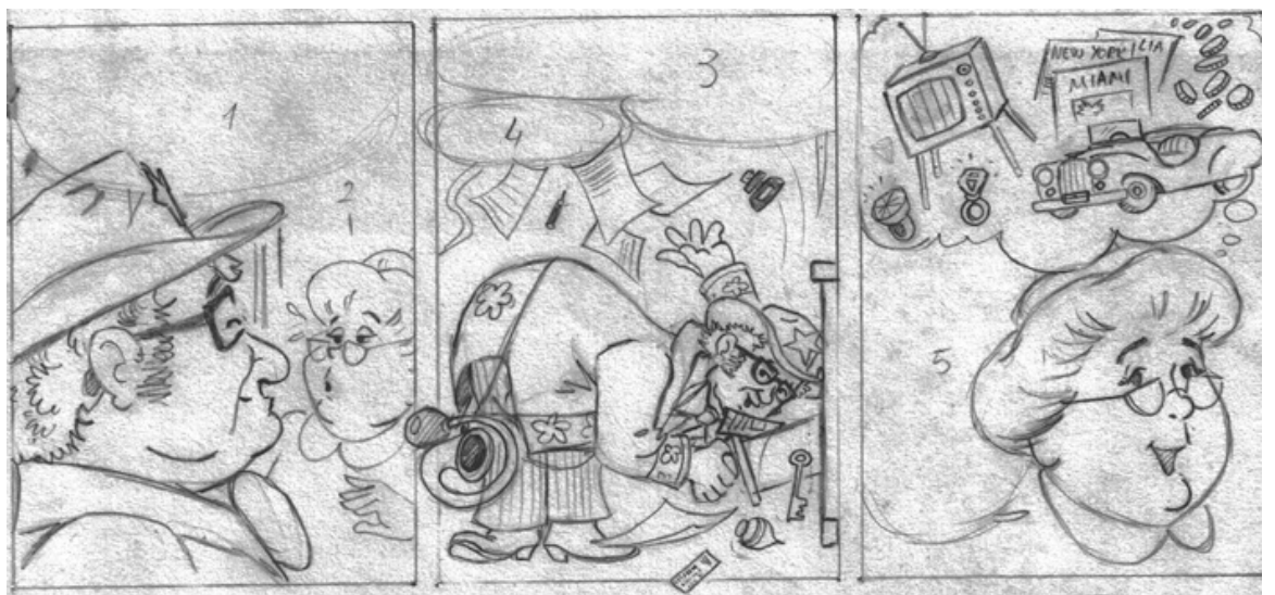
2) Chacrinha e uma das personagens