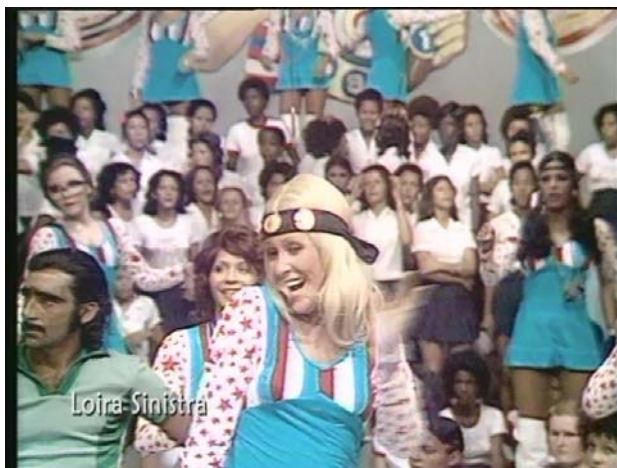
Fig. 1: Chacrete Loira Sinistra na Discoteca do Chacrinha TV Tupi - 1974

Chacrinha, estas dançarinas continuaram a dançar no fundo do palco. Começava ali a era das dançarinas de palco na televisão brasileira.