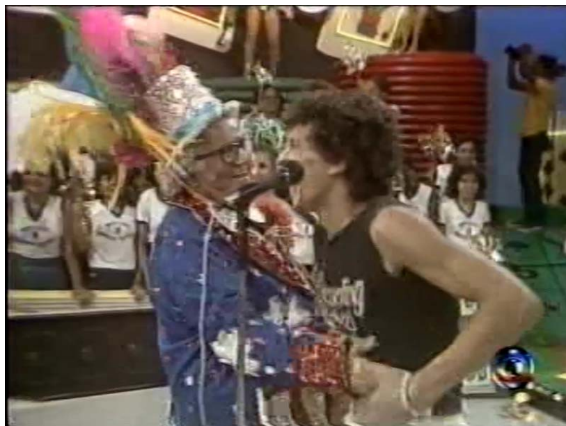
Fig 12: Chacrinha brincando com o calouro, batendo em sua barriga e gargalhando.

Chacrinha gargalha juntamente com o calouro dizendo: “- Vai ser bonito assim no raio que o parta!”