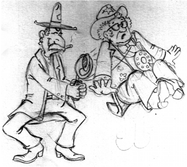
5) Primeiros estudos para a revista.