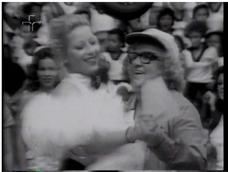
Fig. 8: Chacrinha dançando com uma de suas chacretes.

A câmera volta para Chacrinha, que agarra uma de suas chacretes para dançar. Começa a alternar as câmeras entre o cantor Benito de Paula e Chacrinha dançando, inclusive focalizando os passos do apresentador e os da chacrete.