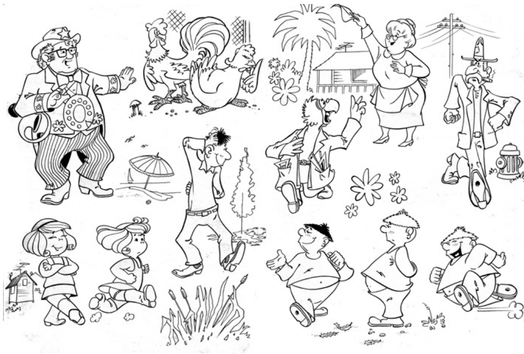
1) Todos os personagens da história