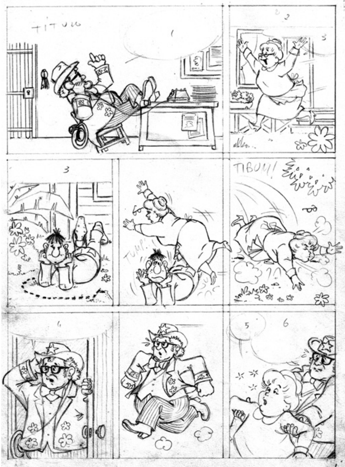
4) Chacrinha se aventurando na ilha.