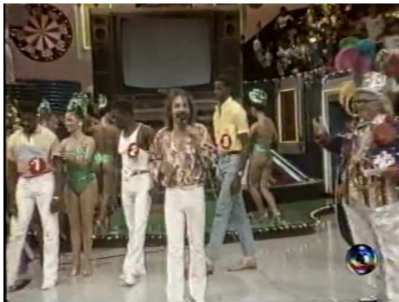
Fig. 10: Cantor Benito de Paula, Chacrinha e os candidatos do concurso “ O negro mais bonito do Brasil ”.

Começa o concurso “ O negro mais bonito do Brasil ”, onde Chacrinha anuncia o prêmio de um milhão de cruzeiros. Todos os candidatos são apresentados, um a um e começa a votação dos jurados. Cada jurado interage não apenas com os candidatos, mas também com o auditório que ora aprova, ora discorda da escolha. Dois candidatos são escolhidos para a final.