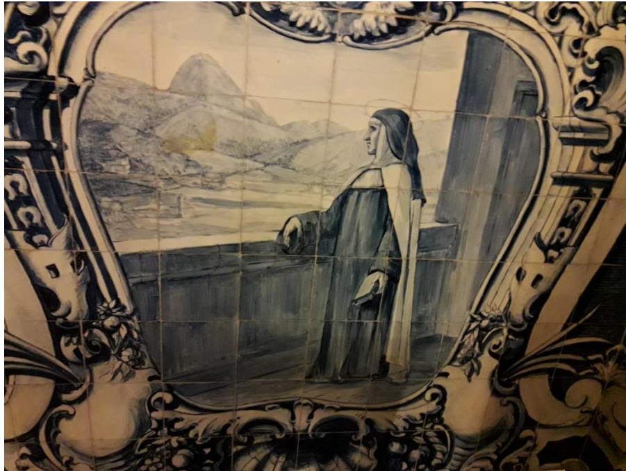
Figura 10 - Azulejo, (1931) P. C. Rossi Osir. Capela da PUC.