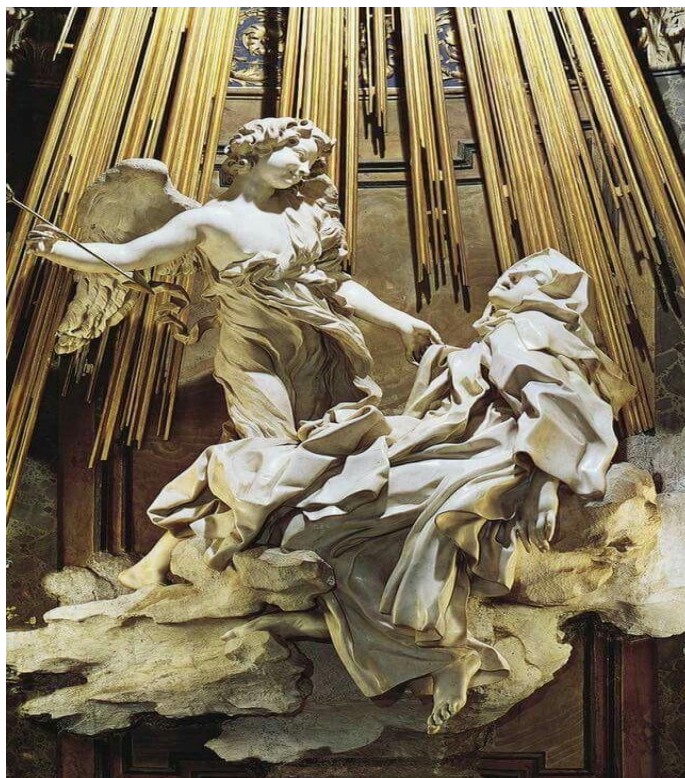
Figura 2 - Escultura de Gian Lorenzo Bernini: “O Êxtase de Santa Teresa, 1651. Escultura em Mármore. Igreja de Santa Maria della Vittoria, Roma.

Essas pinturas eram feitas de modo que despertasse emoção e explicadas pelo clero para que os fiéis memorizassem e reconhecessem os símbolos representados de cada santo. Percebesse que a produção da imagem é definida pelo contexto da sua época, e no século XVII havia uma efervescência da mensagem religiosa, na arte a linguagem do barroco foi muito utilizada para transmitir a experiência mística. “Santiago Sebastián afirmou que a arte do século XVII era uma arte repleta de <<febre interior>>, uma paixão e um desejo de Deus até o aniquilamento 15 ”. Como vemos na expressão da escultura de Bernini: