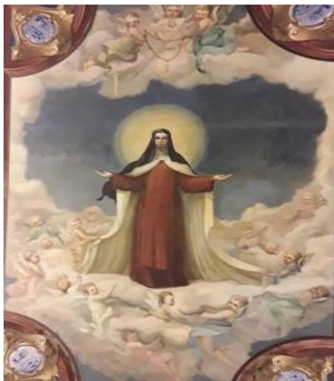
Figura 23 - Pedro Corona (1940). Glorificação de Santa Teresa. (AREIDE. p. 55, 2002). Capela da PUC.

(Representação da graça mística concedida a Santa Teresa no dia 15 de agosto de 1561 na Capela do Santíssimo da igreja de São Tomás em Ávila. “Também por esses dias eu estava... considerando os inúmeros pecados que em tempos passados confessara naquele lugar e outras coisas da minha vida ruim. De repente, veio-me um arrebo tão intenso que quase perdi os sentidos; sentei-me e crio que não vi a elevação nem ouvi a missa, ficando depois envergonhada disso. Enquanto me encontrava naquele estado, tive a impressão de que me cobriam com uma roupa de grande brancura e esplendor. No início, eu não via quem o fazia, tendo percebido depois Nossa Senhora do meu lado direito e meu pai São José do esquerdo adornando-me com aquelas vestes. Eles me deram a entender que eu estava purificada dos meus pecados...Tive a impressão que ela me punha no pescoço um colar de ouro muito formoso do qual pendia uma cruz de muito valor. Era grandíssima a beleza que vi em Nossa Senhora, embora não tenha podido observar nenhum traço particular seu, mas o conjunto do rosto, estando ela vestida de branco, com enorme resplendor, não do tipo que deslumbra, mas algo suave... Nossa Senhora me pareceu muito jovem”. (Vida 33, 13-15 passim). (ARIEDE. p. 54, 2002).