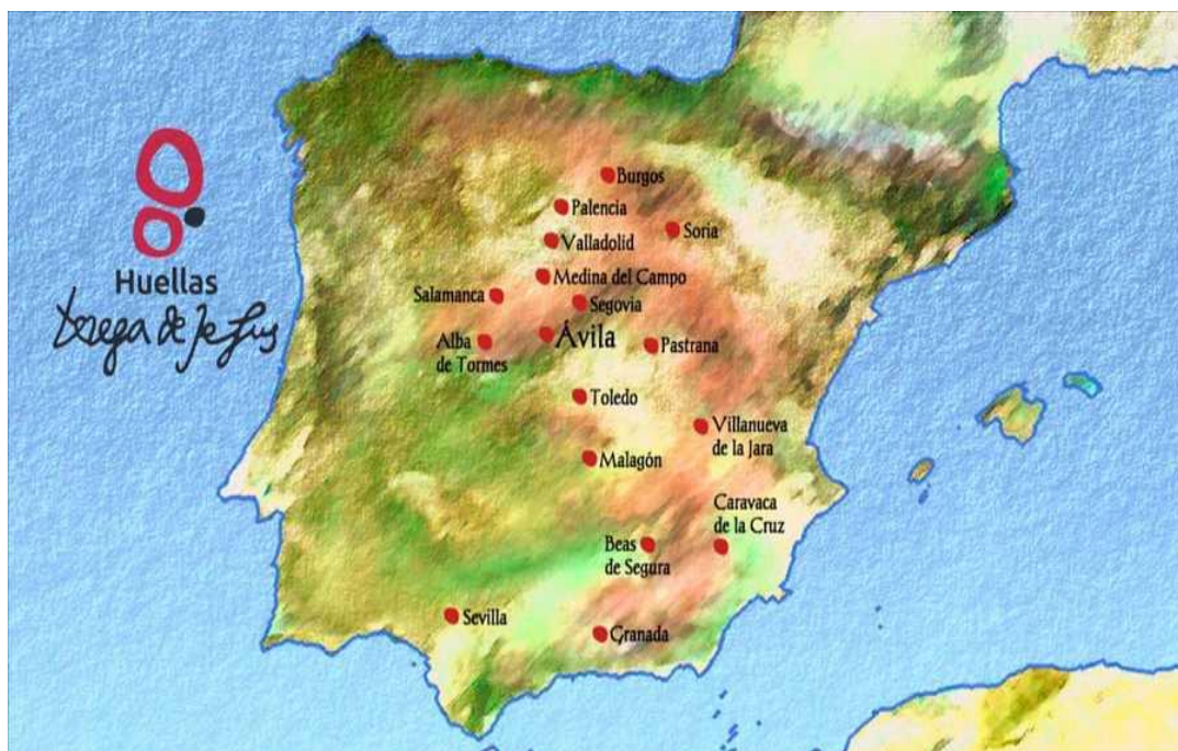
Figura 1 - Mapa onde Santa Tereza fundou os mosteiros de sua Ordem

várias obras escritas, são compostas por livros, poemas, orações. Teresa morre em 1582 em Alba de Tormes dizendo: “Enfim, Senhor, sou filha da Igreja”.