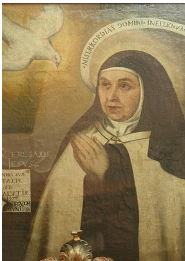
Figura 4 - Retrato de Santa Teresa por Juan de la Miseria, 1576.