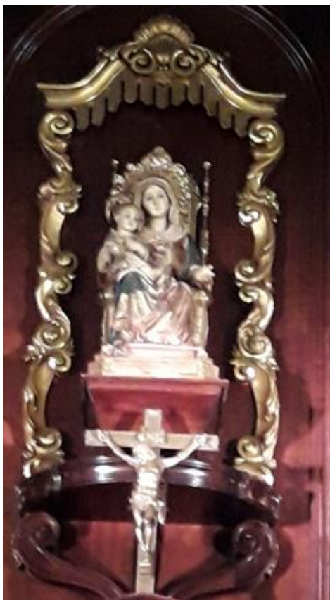
Figura 26 - Escultura Coração Imaculado de Maria e Sede da Sabedoria. R. Pericay. Capela da Puc.