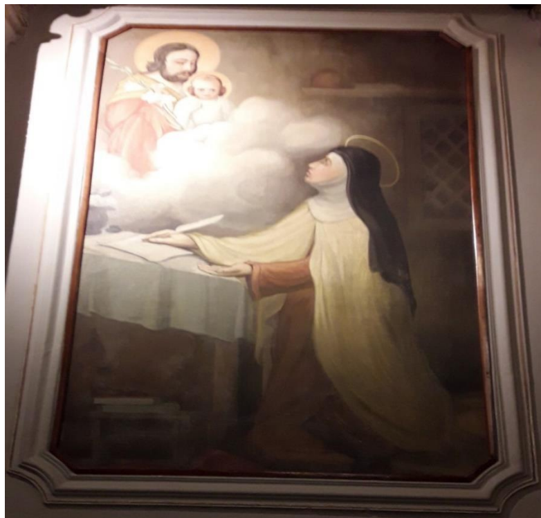
Figura 18 - Pedro Corona (1940). A través dos seus escritos Santa Teresa difunde a devoção a São José. (ARIEDE. p. 72, 2002). Capela da PUC.

para escrever, ele a representa sendo instruída por autoridades máximas como vemos na Figura 18 .