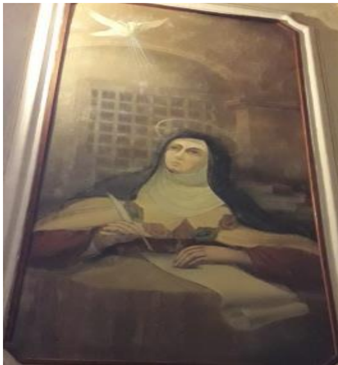
Figura 17 - Pedro Corona (1940). Santa Teresa escritora sob ação do Espírito Santo (Segundo a imaginação do pintor), (ARIEDE. p. 70, 2002). Capela da PUC.