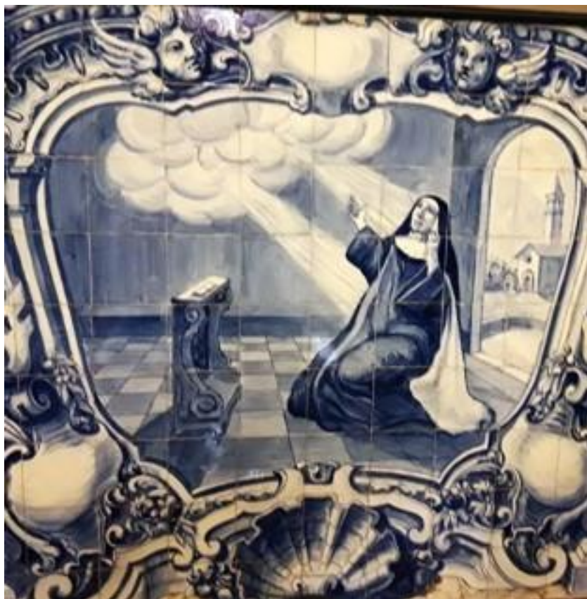
Figura 9 - Azulejo (1931) P. C. Rossi. Capela da PUC.