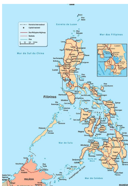
Figura 3- Estados arquipélagos