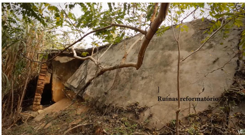
Figura 2: Ruínas do Reformatório