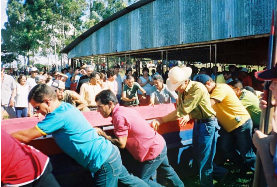
Uma das canoas sendo derrubada.

vegetação, rumo às águas do rio Tietê. Eles gritam uns com os outros, mudam a direção e procuram o caminho mais fácil.