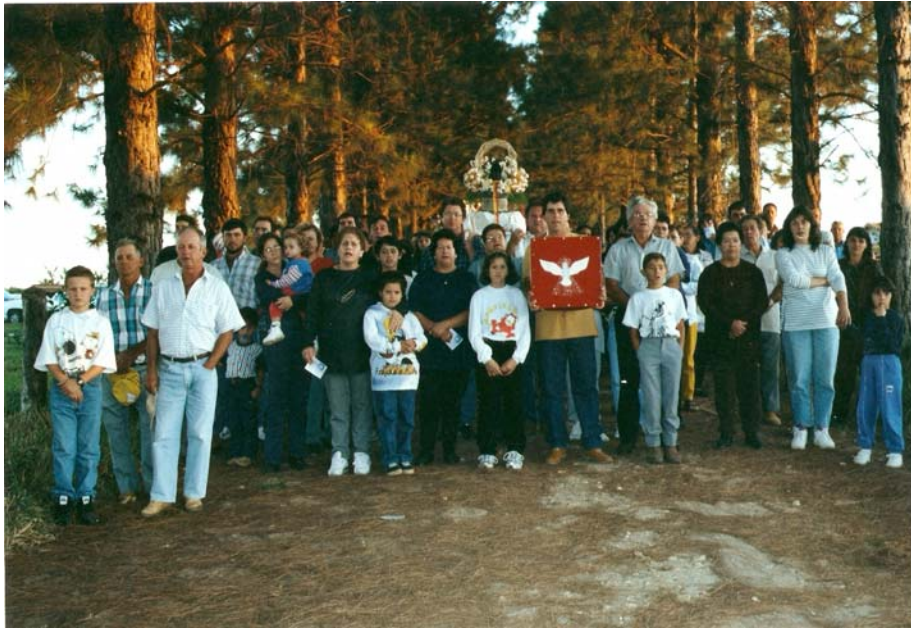
Festeiros na caminhada ao encontro dos Irmãos do Divino.

Perto do mastro, historicamente pintado com as cores do Divino, igual à roupa dos irmãos é que as Bandeiras costumam ser entregues à família anfitriã. Rodeados pelos irmãos e fiéis, a folia mirim 52 saúda novamente o “Encontro” entre o Divino, e as imagens dos santos e santas dos andores dos hospedeiros. Vide canção: (Anexo VI).