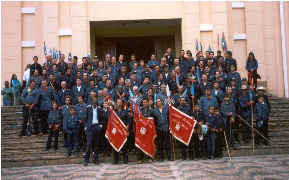
Irmandade do Divino de Anhembi, em frente à Matriz.

Todo terceiro sábado após a Páscoa, a cidade de Anhembi se volta para o Divino. Nas primeiras horas da manhã, espontaneamente, os fiéis, homens se apresentam na igreja, para se oferecerem para zarpar com o Divino. São nove dias de viagem, de acordo com a lista de pousos e almoços (anexo IV), distribuídos no dia da derrubada. Durante o período de romaria, os Irmãos do Divino percorrem a região oferecendo rezas e cânticos. Assim, confirmam a memória local, que se reveste de simbolização entre os devotos do Espírito Santo, como descrito no capítulo I.