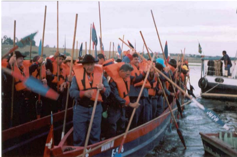
O início da romaria nas águas do rio Tietê.

Todos devidamente embarcados, lentamente as canoas dos irmãos vão se afastando da margem e, assim, mais uma vez, eles reproduzirão, com sua missão, a teia simbólica dos antepassados que enfrentaram uma natureza cheia de obstáculos ou perigos. A romaria é “ uma agência transformadora ”, na medida em que revela como papel importante intermediar o encontro do Divino com os moradores, como forma de fortalecer a fé católica e a força do povo caipira na construção do Sagrado. Os entrevistados costumam dizer que fazer parte deste universo sagrado, dá uma sensação maravilhosa. “ Nessa hora, a gente está movida pela força do Divino. Eu já cheguei a desmaiar de tanta emoção ”, explica um entrevistado.