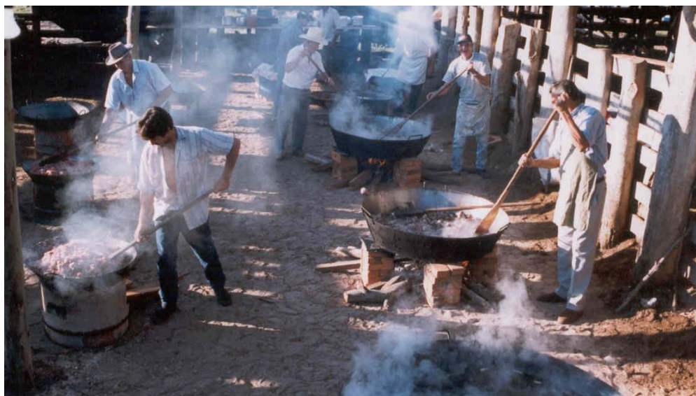
Terreiro da casa do festeiro onde a comida é preparada.

terreiros das casas passam a ser a cozinha e o refeitório, onde, em fogões à lenha improvisados, é preparada a “cozinha” em grandes tachos e panelas. Para centenas de pessoas, a comida é servida em mesas compridas, embaixo de barracões provisórios cobertos de lonas, ou galpões.