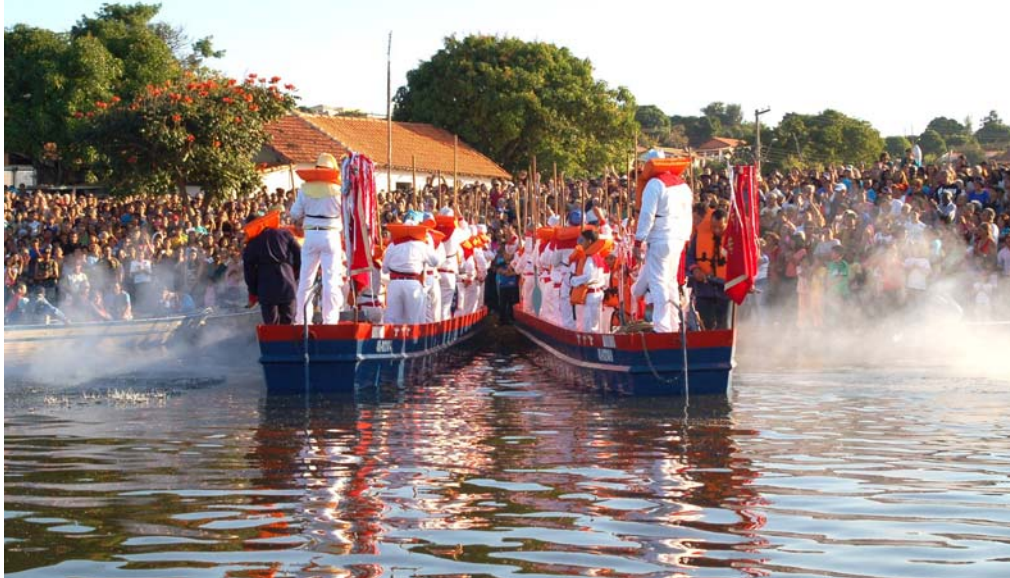
O povo celebra o Divino.

comércio de produtos de festas, festival de (músicas e bebidas) e espetáculos como rodeio de touros e cavalos tornam-se cada vez mais presentes. 67