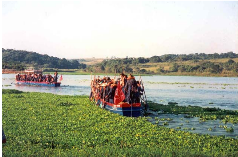
Canoas fazem sua peregrinação pelo rio Tietê.

pesadas canoas rio-abaixo para, depois de 50 minutos, chegar ao local próximo ao primeiro pouso.