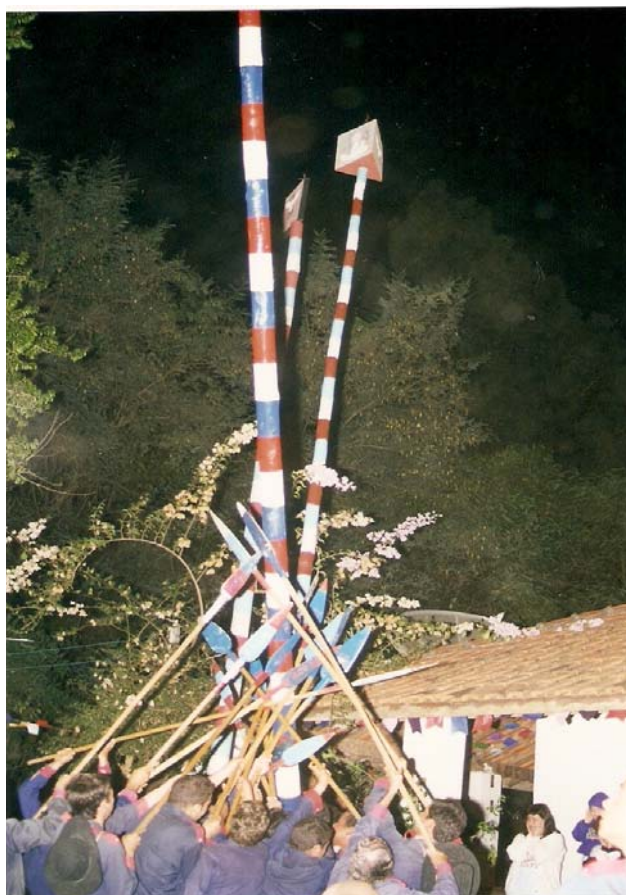
Levantamento do mastro.

Por guardar e produzir o poder de marcar o ponto fixo da centralidade do Sagrado, a Irmandade é a única que tem o poder de levantar o mastro do Divino, feito e encomendado pelos moradores. Alguns mastros chegam a ter cinco metros de altura. Para os romeiros, é pelo mastro que se fará a ligação entre o visível e o invisível, entre o espaço terreno dos vivos e o espaço celeste, o reino sagrado do Divino Espírito Santo.