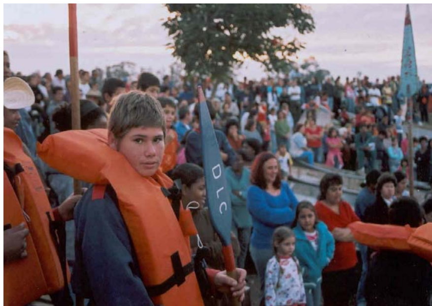
Irmãos com suas iniciais no remo pronto para navegar.

podemos notar que os padrões reinantes no interior da organização sócio/religiosa serão mantidos, dada a integração e o interesse demonstrados pelos pequenos.