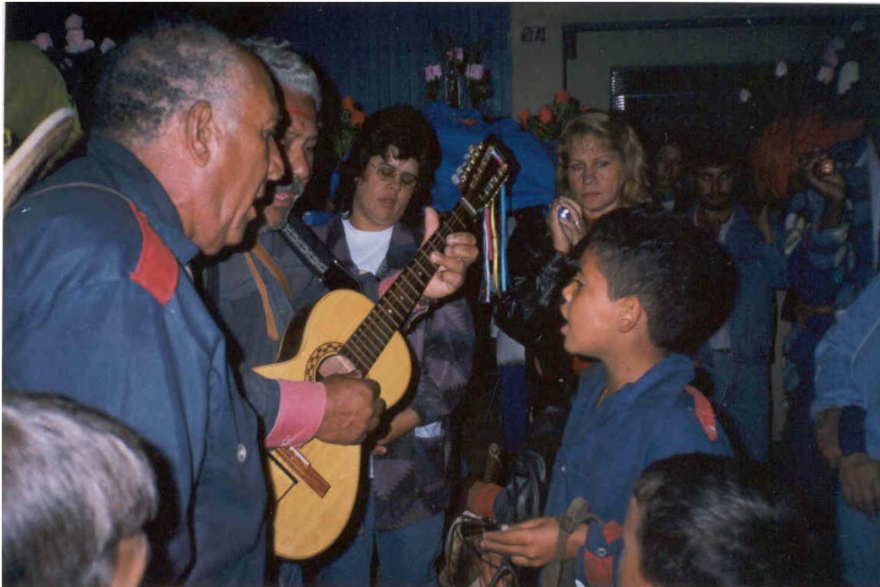
Cantores mirins e o cântico dos pedidos.

Como mencionei no capítulo dois, durante a viagem, nas pousadas, almoços e cafés, os foliões saúdam o rico encontro do Divino Espírito Santo e as imagens de santos preferidos das comunidades. Saúdam os festeiros, a família e as pessoas convidadas e agradecem as pousadas, os almoços e os cafés, cantando a despedida em nome da Irmandade, para voltarem no ano que vem e se encontrar na festa.