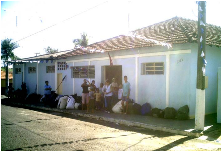
A casa de Anhembi dedicada ao Divino Espírito Santo.

estandartes, etc. É também na Casa do Divino que são abrigados os irmãos que vêm de longe e são feitos e servidos o almoço dos irmãos no dia do embarque e o jantar do dia da grande festa, logo após a santa missa campal, celebrada depois do encontro dos barcos, nas águas do rio Tietê. A Casa do Divino, tanto de Anhembi, quanto das demais cidades abrangidas por este trabalho, têm, para os católicos veneradores do Divino Espírito Santo, a mesma importância da Igreja, é a casa de Deus.