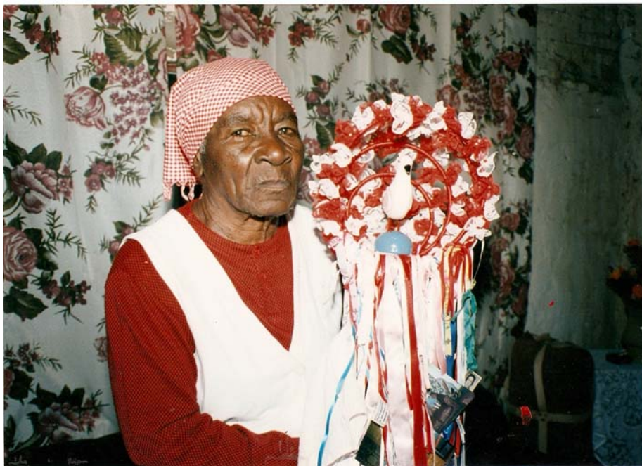
A Bandeira do Divino é sinal da presença do Espírito Santo no meio do povo.

É ainda Brandão (1974) que chama a atenção para o fato de que, no contexto da Igreja Católica, todo o tempo litúrgico de Pentecostes 28 é regido pela cor vermelha. No ritual católico, o vermelho simboliza as línguas de fogo com que o Espírito Santo veio aos apóstolos, confirmando-os e fortalecendo-os na fé. Para os católicos, o vermelho simboliza fortaleza e configuração na fé. No catolicismo popular, a pombinha branca e/ou prateada, que aparece na Bandeira do Divino Espírito Santo, é uma figura viva, que vai encimada sobre um pedestal de lenho coberto por um pano de cor vermelho vivo, que representa o fogo que ilumina o caminho.