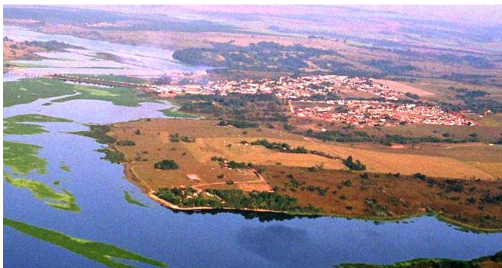
Vista da cidade de Anhembi.

O rio Tietê é o principal acidente geográfico da região. Participa da vida da cidade e nas festividades do Divino, desde o primeiro preparativo que é a derrubada das canoas. No rio, ocorre o ponto alto da festa, o encontro das canoas, bem como a cerimônia final, quando da retirada dos barcos de suas águas.