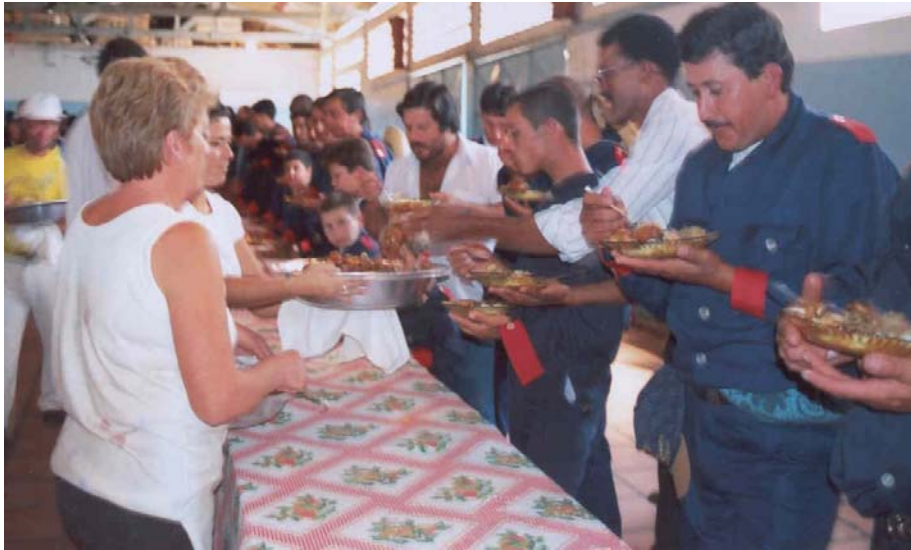
O almoço do Divino.

O alimento é oferecido pelo festeiro (dono do almoço ou jantar) que, como pagamento de promessas, recebe ajuda dos amigos para os afazeres da casa, como servir, lavar pratos, buscar água, abater animais e preparar a comida. No preparo, trabalham tanto homens como mulheres. Os louros, porém, são reservados para os homens, o que nos tempos atuais, revela raízes do passado de discriminação à mulher que, nas festas, se conservavam à parte. A esse respeito expõe Antônio Cândido (1982):