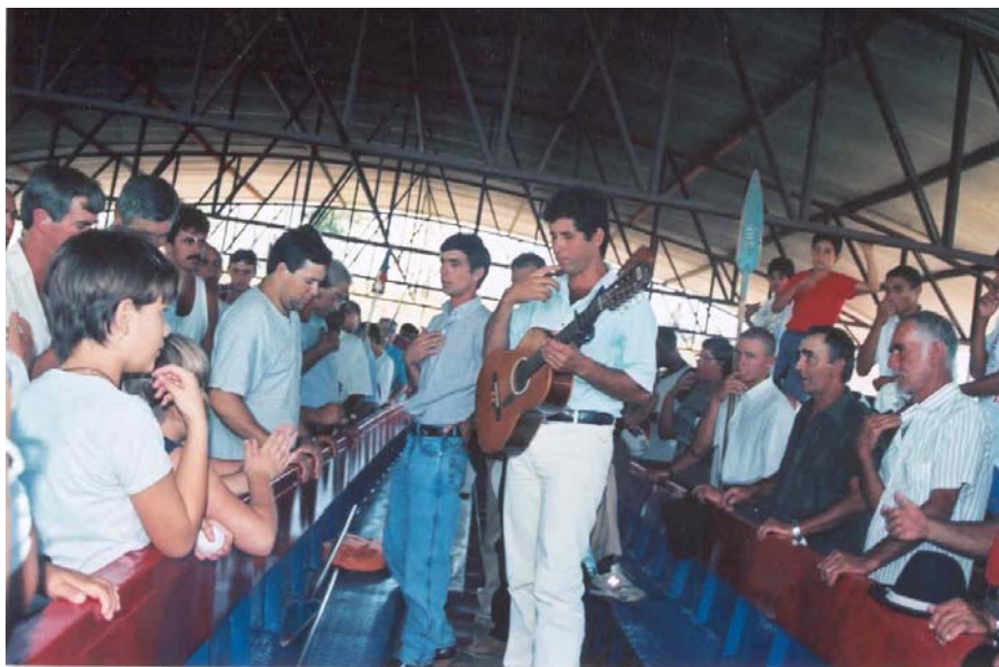
No galpão, os irmãos cantores dedilham a viola para louvar o Divino.

Esta canção reúne, em palavras, o espírito que envolve todos os participantes, a união da religiosidade com vínculos comunitários e a alegria de externar a paz e a força interiores, presentes em todos. Expõe, também, a tradição e a esperança de melhora para os enfêrmos e prosperidade para todos. É este o espírito que presenciei em todas as vezes que participei do rito da derrubada das canoas de Anhembi. Os mesmos fatos se repetiam e marcaram a sociabilidade envolta por espontaneidade, solidariedade e a preocupação de uns ajudarem aos outros.