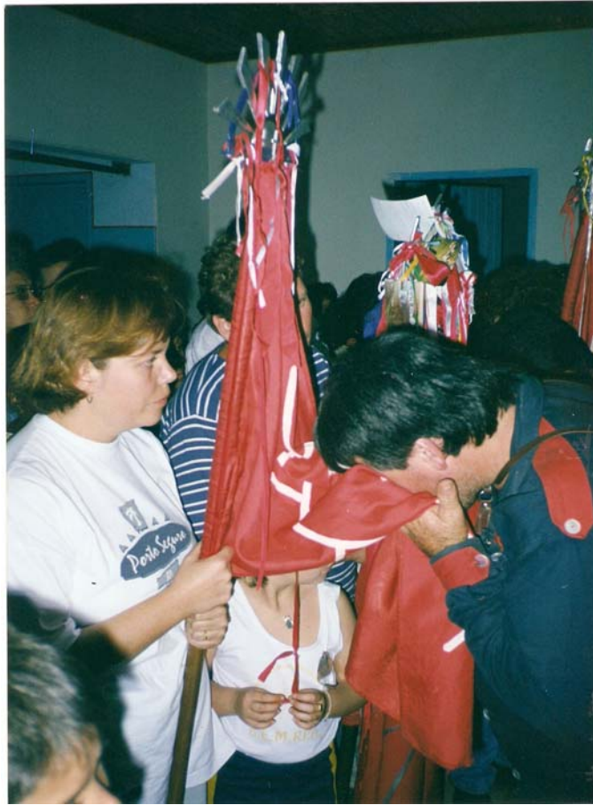
O Irmão do Divino se despede da Bandeira do Divino.