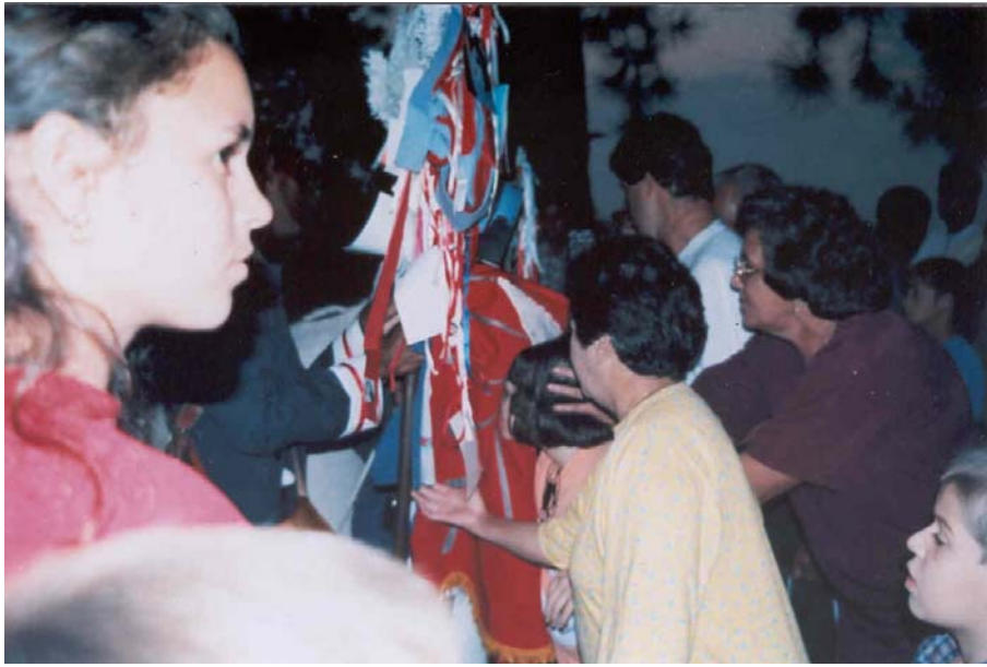
Fiéis beijam e tocam a bandeira do Divino.

A maioria dos fiéis é formada por pessoas humildes originárias da roça, trabalhadores braçais que têm fortes raízes com a causa do Divino Espírito Santo. Os seguidores das Irmandades do Espírito Santo, participantes da pesquisa, são autênticos caipiras, visto pela coletividade como gente agradecida, pura e fiel. Enquadram-se, por isso, na perspectiva dos valores e das crenças, ratificadas pelos estatutos da Irmandade, que pregam fidelidade, companheirismo e crença.