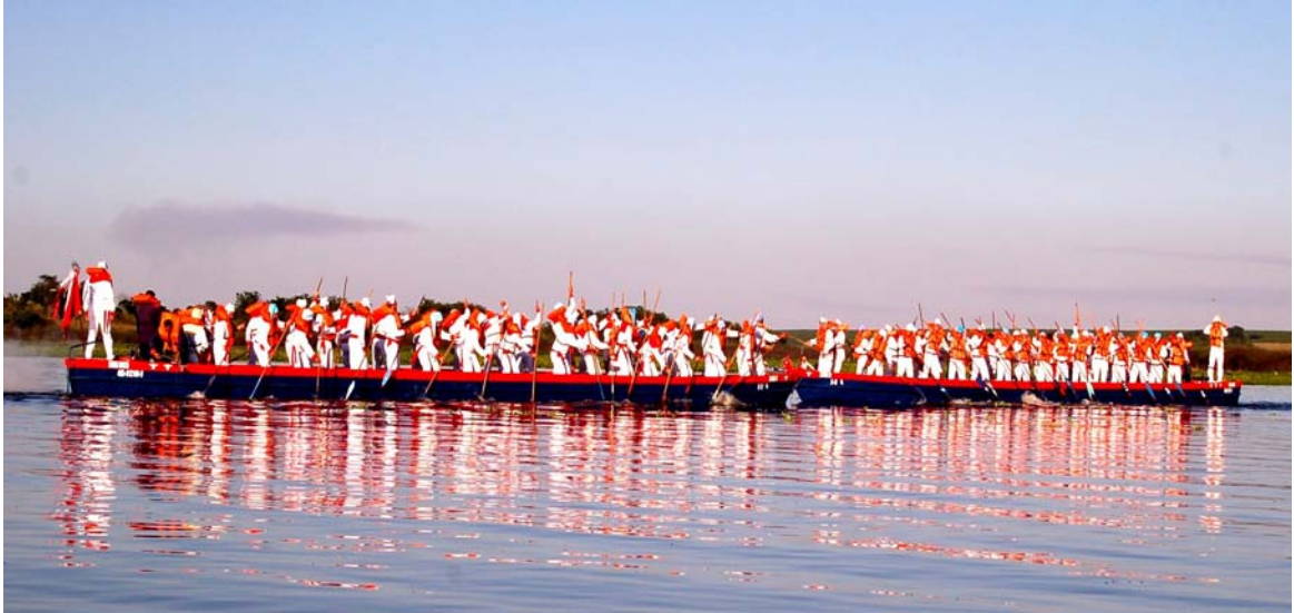
No leito do rio o encontro dos barcos.