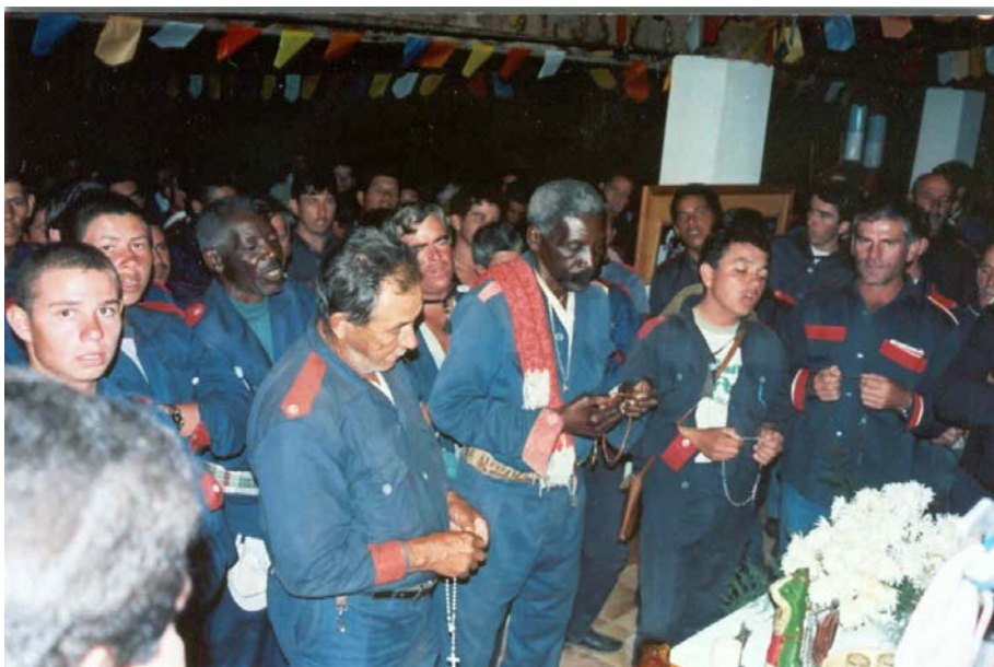
A reza do terço cantado.