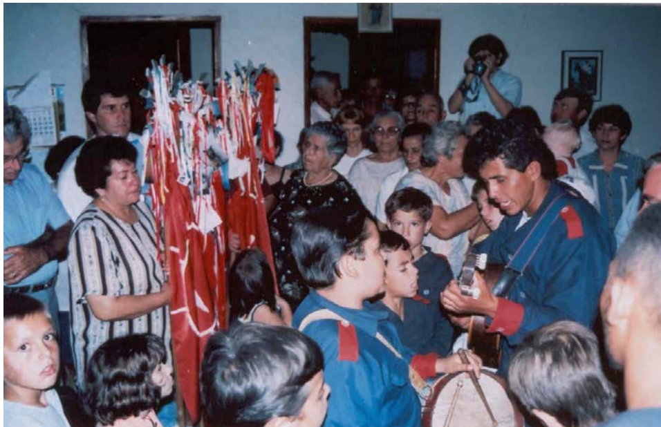
A anfitriã: devoção e muita fé.

Após o levantamento do mastro, o festeiro e sua família colocam-se ao lado do altar, segurando as Bandeiras do Divino. Observa-se a troca de dádivas. Por meio de cânticos da folia mirim (anexo VI), são realizados os pedidos de almoços, pousos (hospedagem) e a licença para entrar na casa com o Divino.