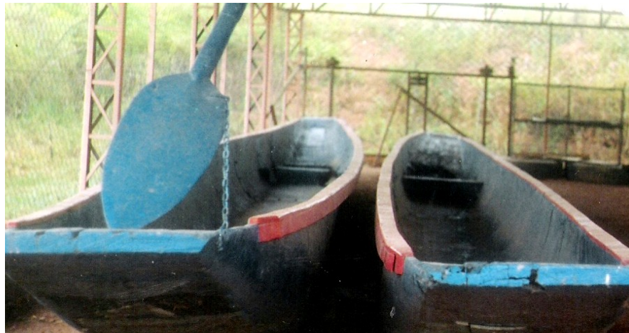
As duas canoinhas de um pau só.

Escavar madeiras inteiras e/ou num grande pedaço de pau era um recurso utilizado pelos primeiros colonos e seus descendentes, que nada acrescentaram às técnicas de construção dos homens da terra (Holanda, p. 28).