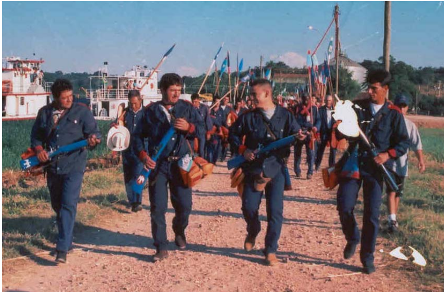
Integrantes do batalhão de trabuqueiros da Irmandade de Anhembi.

misturam-se com as cores das vestes dos irmãos, que vêm atrás dos trabuqueiros, 46 dando um toque especial ao colorido da caminhada.