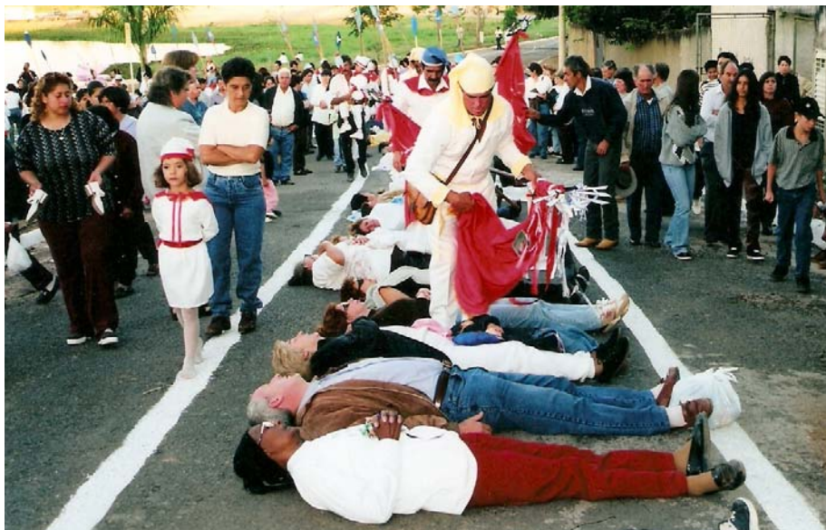
Fieis deitam-se para o Divino: Os amortalhados.

Para a entrevistada: O fiel pede, o Divino atende.