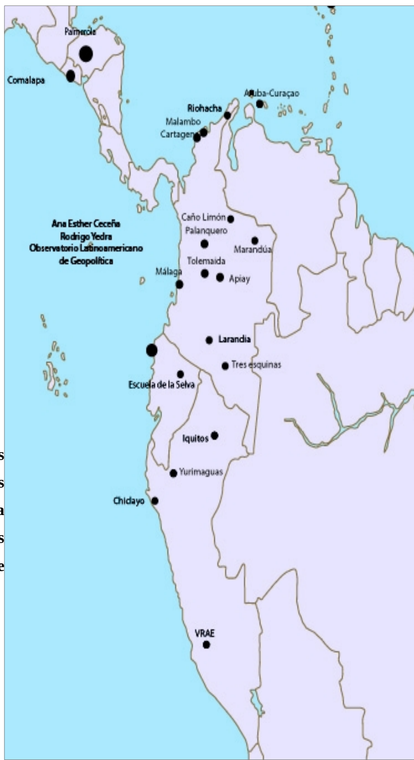
Anexo 4: Bases militares dos EUA na Colômbia após os acordos de 2009