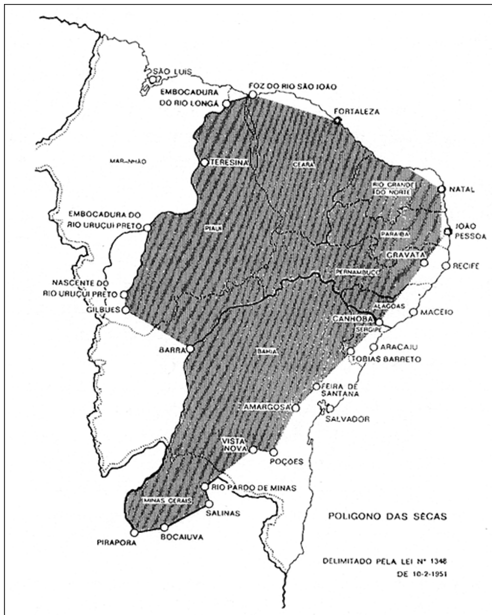
Mapa 1 - Polígono das secas.