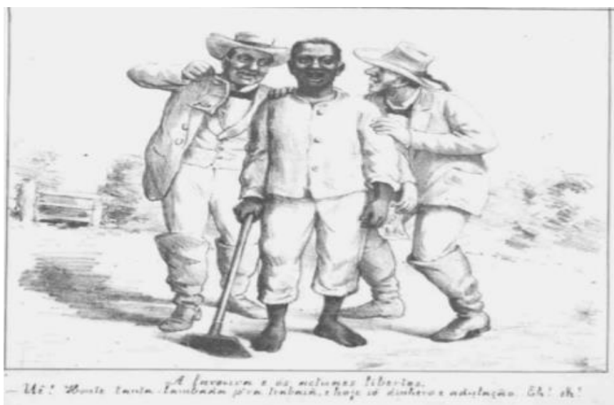
Imagem 11: “A lavoura e os actuaes libertos. Uê! Honte tanta lambada p’ra trabaiaá, e hoje só dinheiro e adulação. Eh! Eh!”.