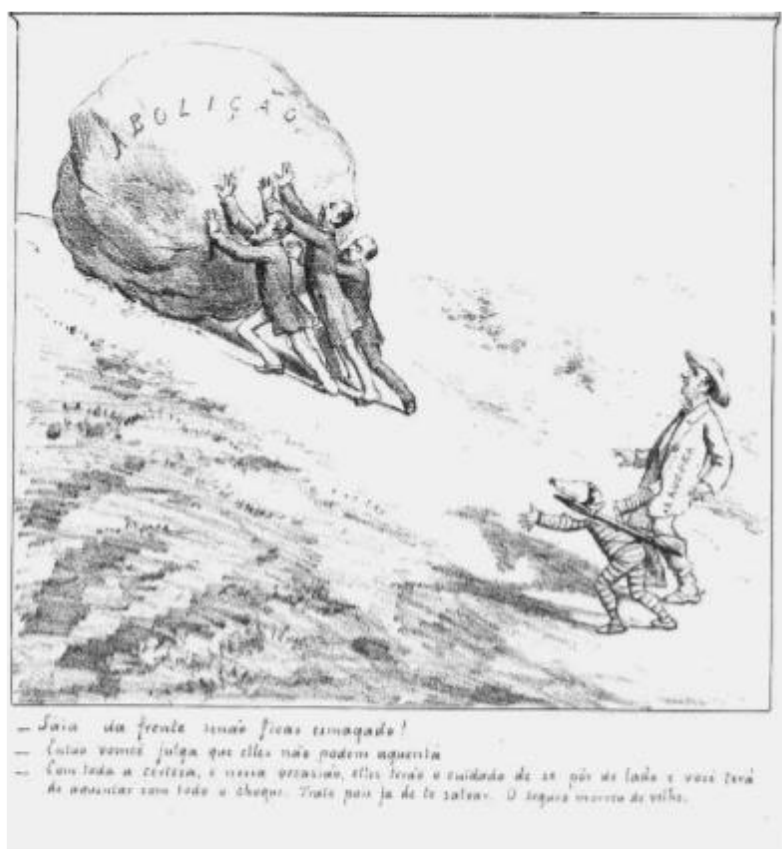
Imagem 07: “— Saia da frente senão ficas esmagado! - Então vomcê julga que eles não podem aguentá.- Com toda a certeza, e nessa ocasião, eles terão cuidado de se pôr de lado e você terá de aguentar com todo o choque. Trate pois já de te salvar. O seguro morreu de velho!”.