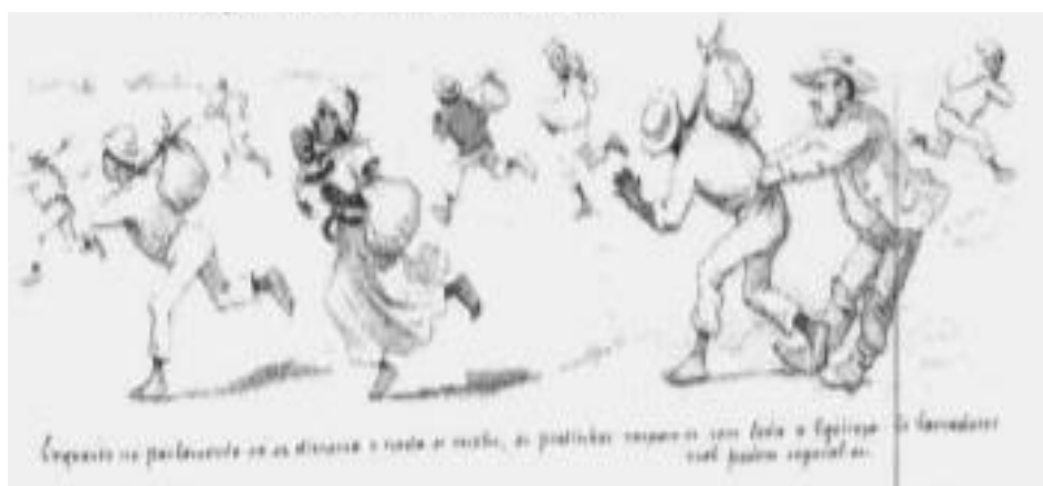
Imagem 09: “Enquanto no parlamento só se discursa e nada se resolve, os pretinhos raspam-se com toda a ligeireza. Os lavradores mal podem segurá-los.”