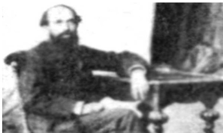
Imagem 1: João Romeiro (1842 – 1915)