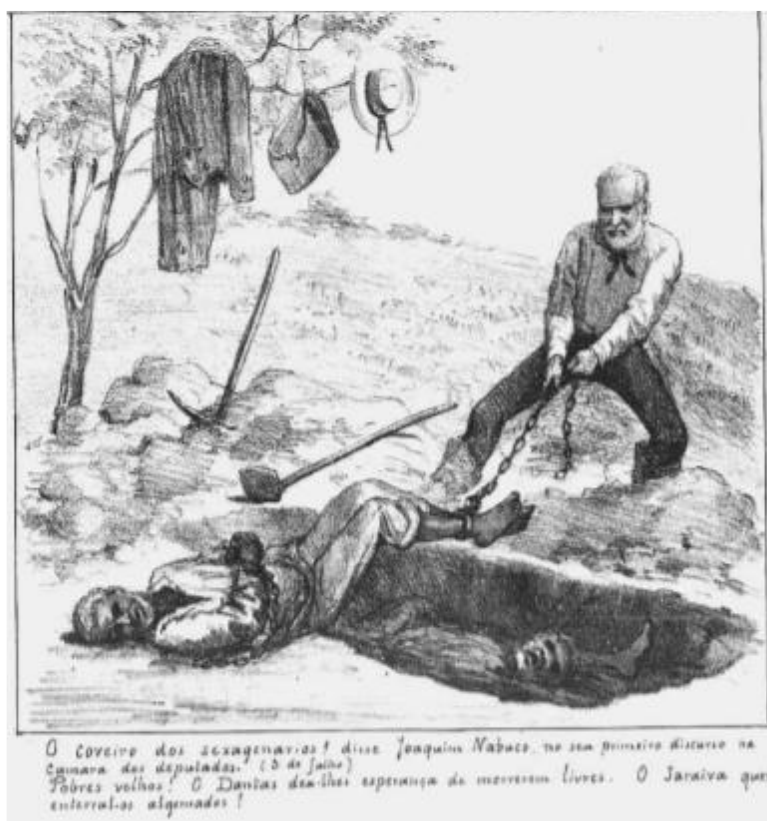
Imagem 06: "O coveiro do sexagenário! disse Joaquim Nabuco, no seu primeiro discurso na Câmara dos deputados (3 de Julho). Pobres velhos! O Dantas deu-lhes esperanças de morrerem livres. O Saraiva quer enterrá-los algemados."

Fonte: Revista Ilustrada, ano 10, n.413, 30 de junho de 1885, p.1.