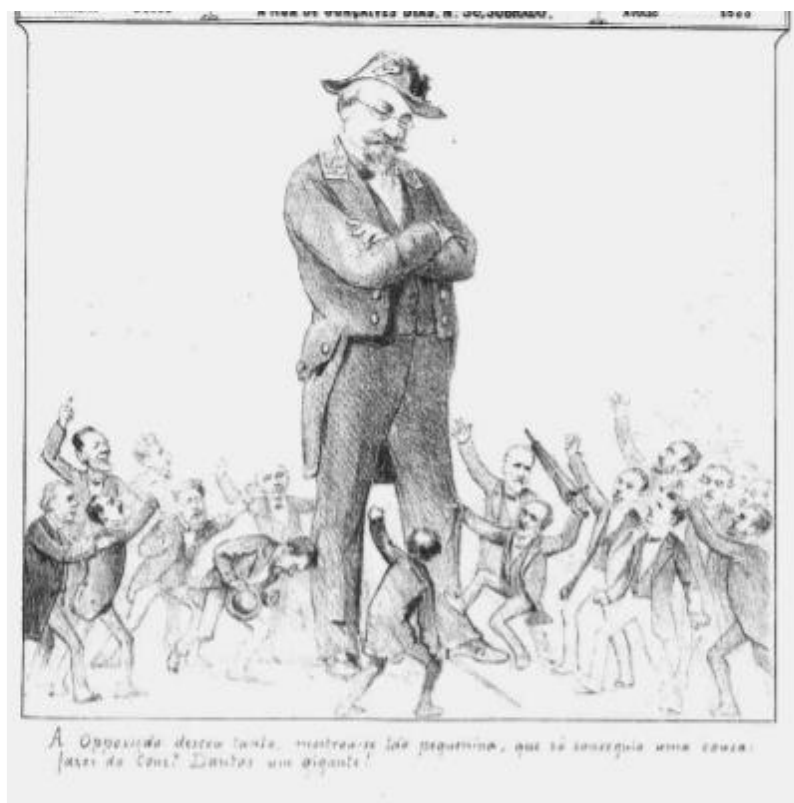
Imagem 04: “A oposição desceu tanto, mostrou-se tão pequenina, que só conseguiu uma cousa, fazer do Cons. o Dantas um gigante”.