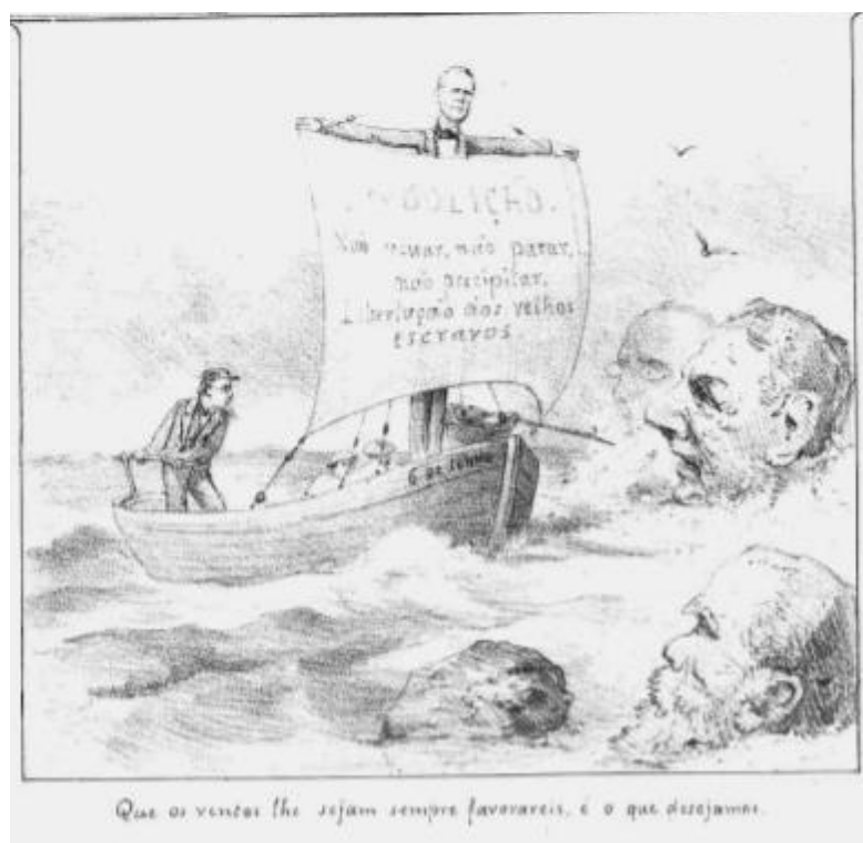
Imagem 03: “ Que os ventos lhe sejam sempre favoráveis, é o que desejamos ”

Fonte: “Abolição. Não recuar, não parar, não precipitar. Libertação dos velhos escravos”.