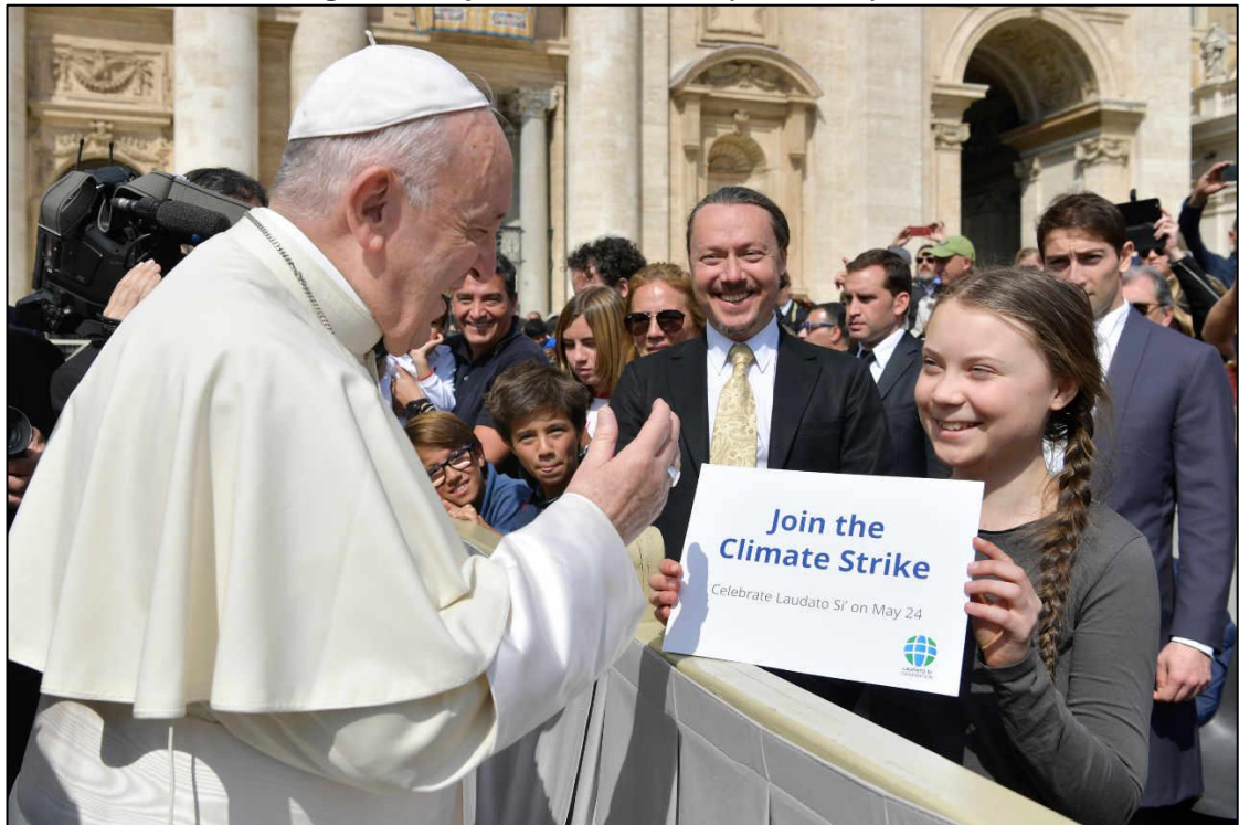
Figura 1: Papa encontra Greta (abril 2019)

40 anos depois da obra de Hans Jonas, na abertura da Cúpula do Clima da ONU, em setembro de 2019 em Nova Iorque, Greta perguntava aos adultos: “ Vocês vêm até nós, os jovens, em busca de esperança. Como ousam? ” (NEXO, 2019).