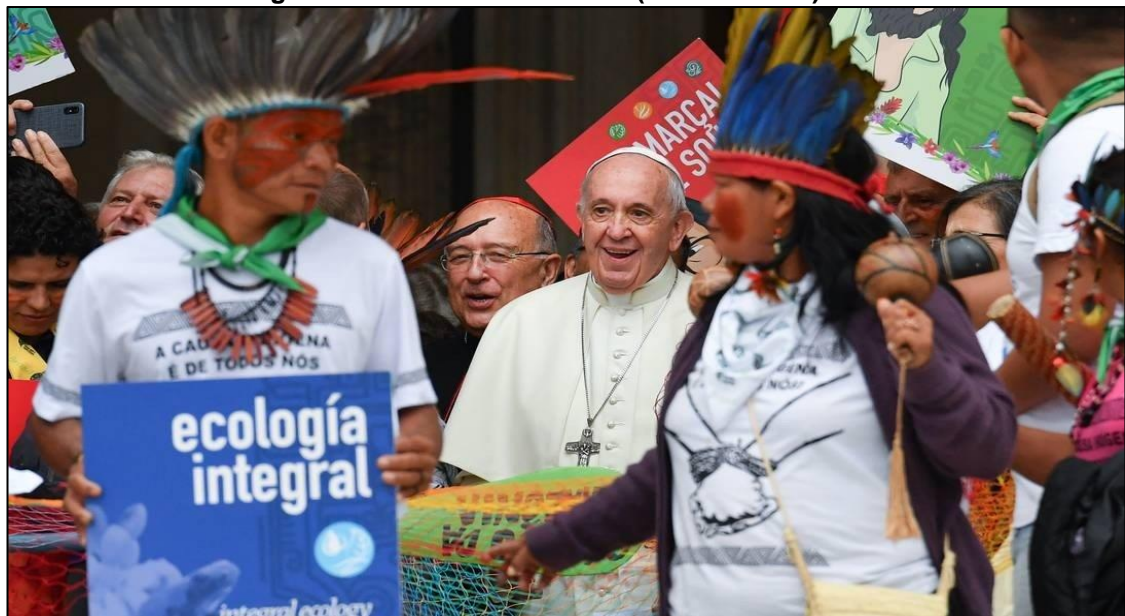
Figura 2: Sínodo da Amazônia (outubro 2019)

Para Spadaro 40 , Bergoglio identifica nas populações indígenas um ponto de partida necessário. Como uma Igreja pode entender a si mesma? De onde deve começar? Em Medellín (1968 “se redescobria uma igreja escondida, composta por reminiscências de mais de 2.600 povos nativos, com suas inúmeras línguas e tradições”. Depois, na Conferência de Santo Domingo