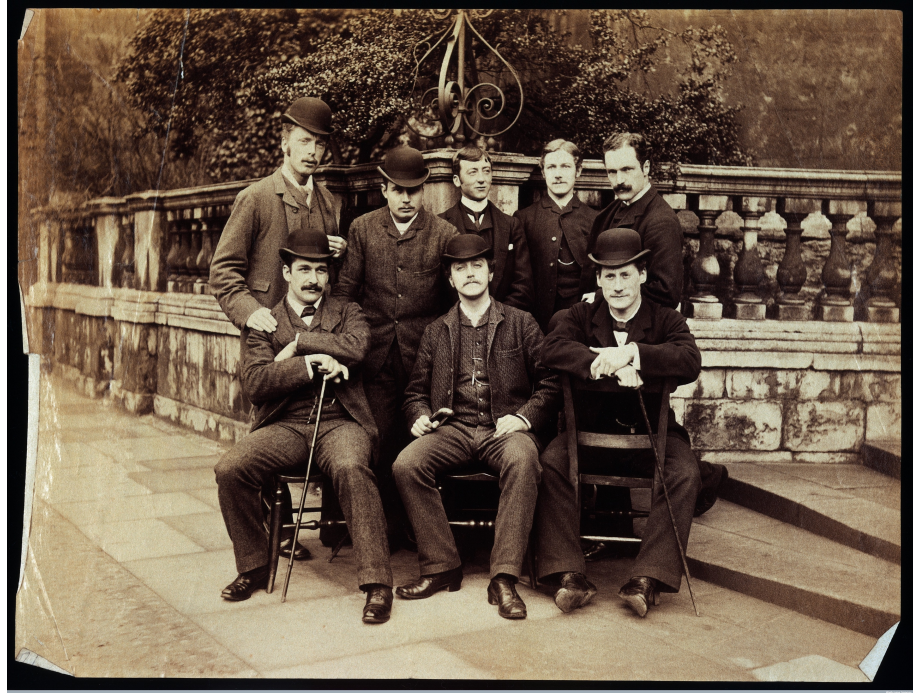
Estudantes de Trinity College, Cambridge. Fotografia, fim do século XIX.

Rendendo-se às lamúrias infantis, o pai conforta a criança dizendo que pela manhã traria uma armadura similar à do vizinho para que vestisse. E, voltando-se à sua esposa, finaliza a narrativa dizendo “isso é melhor do que qualquer armadura medieval”. “Mais tarde, metido nesse fraque e com a ajuda do anel simbólico e do guarda-chuva de cabo de ouro, se êle for jeitoso e tiver uma certa compostura de maneiras, poderá alcançar tudo o que quiser na vida”.