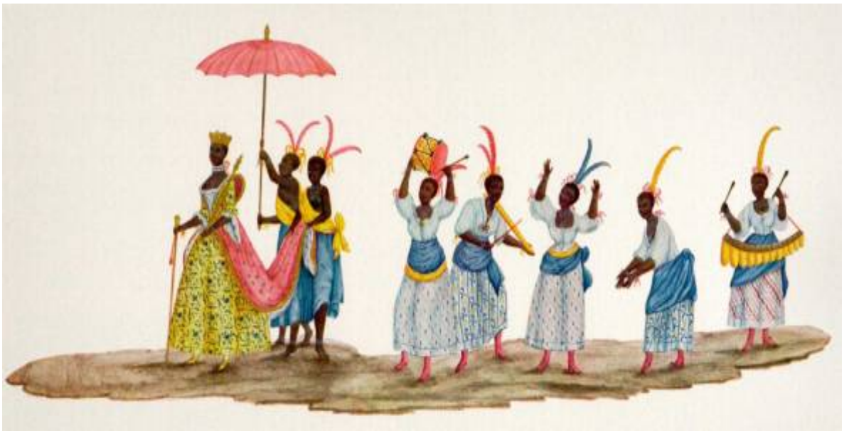
Coroação de uma rainha na Festa de Reis