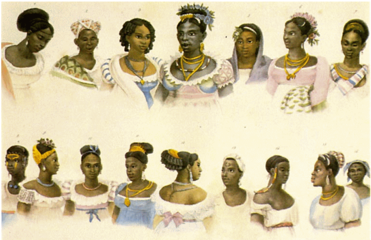
Mulheres negras de diferentes nações