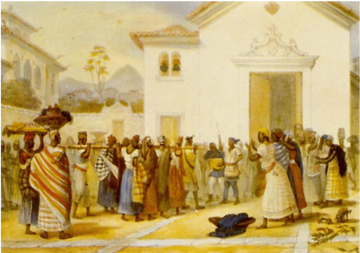
Enterro de uma escrava