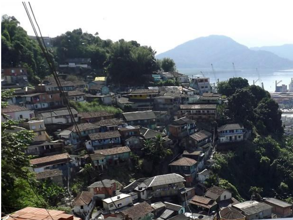
Figura 2: Morro do Pacheco. (Crédito: Ivair Vieira Jr/G1. Disponível em: < http://g1.globo.com/sp/santos-regiao/noticia/2013/09/licitacao-para-teleferico-nos-morros-de-santos-comeca-nesta-segunda-feira.html >). Acesso em: 24 jan 2016.