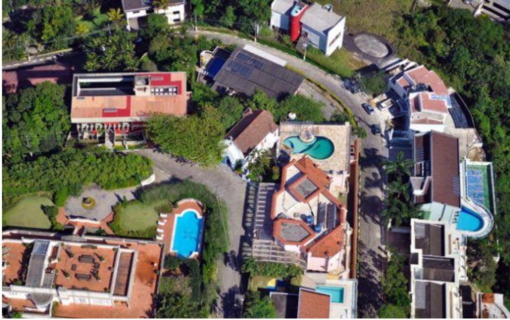
Figura 1: Condomínio de luxo situado no Morro de Santa Terezinha. (Crédito: Jornal da Orla, 4 mai. 2015. Disponível em: < http://www.jornaldaorla.com.br/noticias/2460-polemica-no-alto-do-morro/ >). Acesso em: 24 jan 2016.