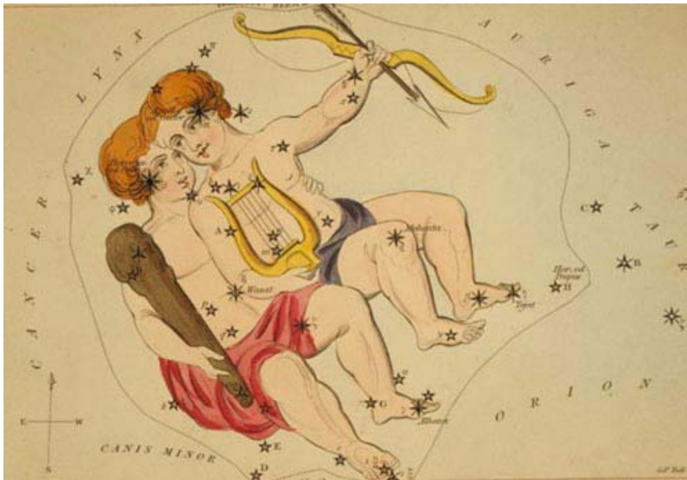
Representação dos gêmeos na astrologia.

frequência, seu duplo entre si e o adulto, já que um e outro têm exatamente as mesmas necessidades vitais e as mesmas expectativas afetivas”. (p.157)