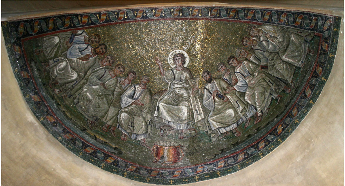
Basílica S. Lorenzo - Capela S. Aquilino (Milão, mosaico do séc. IV).