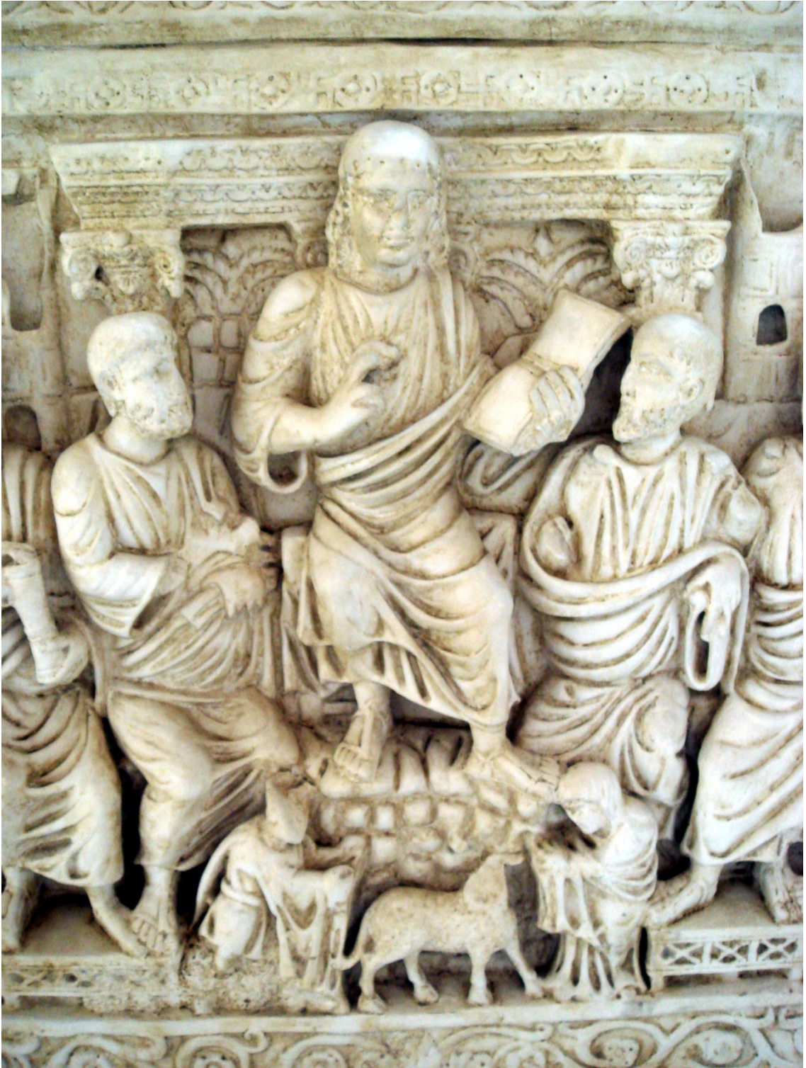
Sarcófago de Stilicone, (Basílica de Santo Ambrósio, Milão, segunda metade do séc. IV).