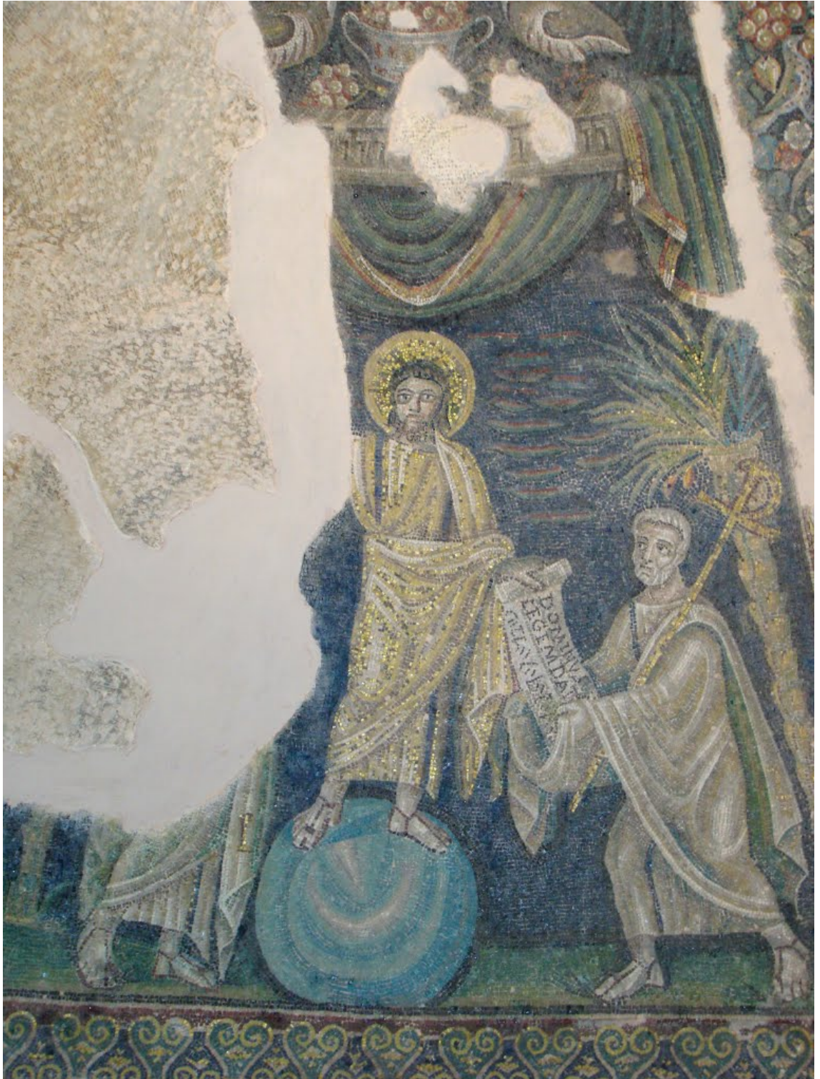
Batistério de San Giovanni in Fonte (Nápoles, mosaico do séc. V).