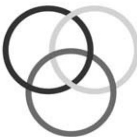
Figura 1 – Nó borromeano de três aros.

A topologia dos nós é um novo recurso para se mostrar como opera a clínica psicanalítica e sua demonstração requer pensarmos o nó numa dimensão plana, onde os conjuntos são constituídos por entrelaçamentos discursivos, para depois pensarmos os casos clínicos. Primeiro o nó a três: Trata-se de um nó (ou cadeia) na qual: 1) se for solta uma rodela, as outras se desatam; 2) as rodela são superpostas e não entrecruzadas; 3) elas estão enodadas de tal forma que duas estejam livres; 4) elas fazem existir um buraco.