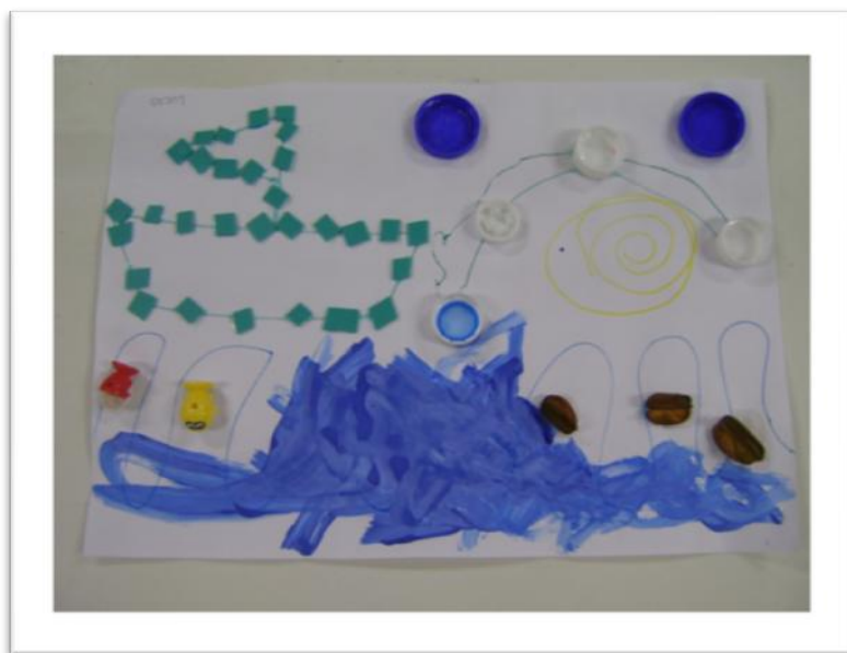
Navegar – Galeria de Arte – Escola Hospitalar