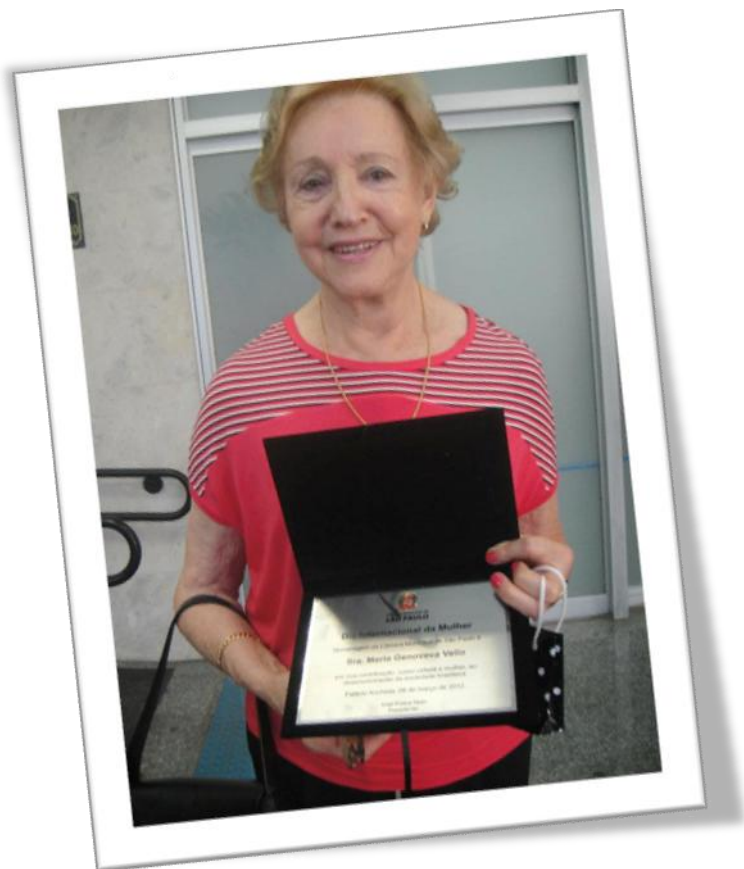
Homenagem ao Dia da Mulher, Câmara de Vereadores da Cidade de São Paulo, 2012.

Terminamos minha filha, terminamos. Obrigada muito obrigada.