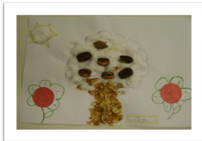
Sementes - Galeria de Arte – Escola Hospitalar

Eu, nessa hora, percebi que a minha responsabilidade cresceu muito, porque, apesar de eu achar isso maravilhoso, de achar que isso tinha que acontecer, eu nunca tinha visto, nunca tinha ouvido falar de uma escola dentro de um hospital.