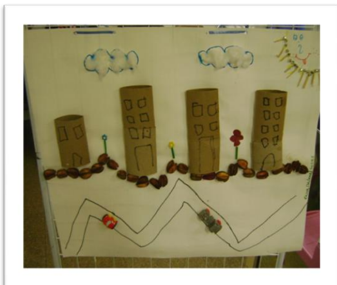
São Paulo - Galeria de Arte – Escola Hospitalar

Ele ficou feliz no dia seguinte faleceu, foi embora no caixão, mas se vê que conheceu São Paulo e era o que mais queria.