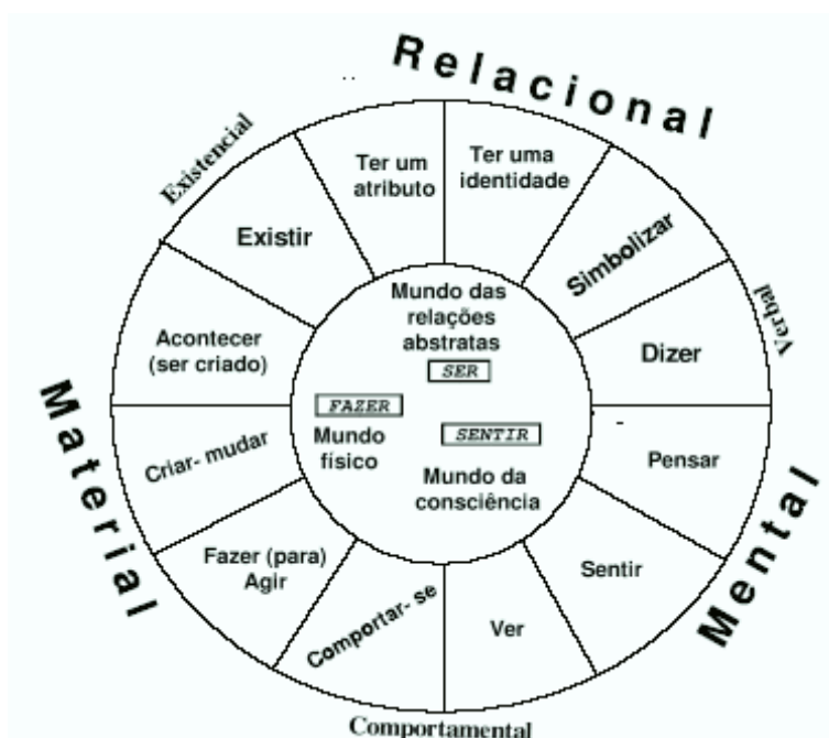
Figura 2: Os tipos de Processos (traduzido de Halliday, 1994:108).

A figura 2, abaixo, extraída de Halliday (1994), ilustra os tipos de processo e o tipo de significado veiculado por cada um.