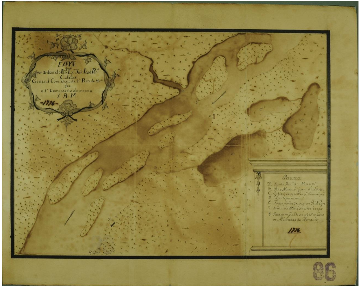
Pintura em aquarela, ano de 1786.