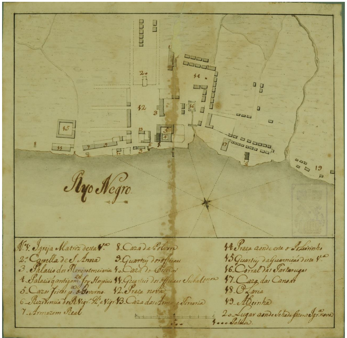
Pintura em aquarela.

Planta da Vila de Barcelos, feita pelo capitão Felipe Sturm. Contendo a igreja matriz, capela de Sant' Anna, palácio dos plenipotenciários, casas feitas para o serviço, palácio que foi hospício, casas feitas para o governo, residência dos vigários, armazém real, casa da pólvora, quartéis dos oficiais, casa do ouvidor, quartéis dos oficiais subalternos, praça nova, casa das armas, praça onde está o pelourinho, quartéis da guarnição, curral das tartarugas, casa das canoas olaria e finalmente as casas de moradia dispostas uma ou lado da outra etc. 202