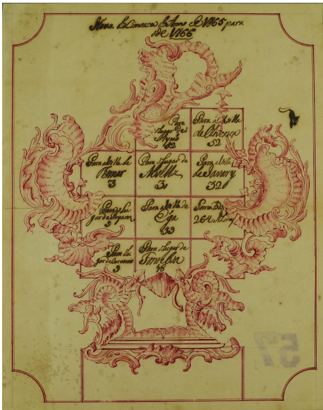
Aquarela em vermelho com tinta de escrever, papel linho.

Lugar de Airão – 52, vila de Olivença – 52, vila de Thomar – 3, lugar de Avellos – 30, Vila de Javary – 32, lugar de Poyares – 9, vila de Ega – 59, lugar de Carvoeiro – 9, lugar de Fonte Boa – 18, Soma = 264 almas. 207